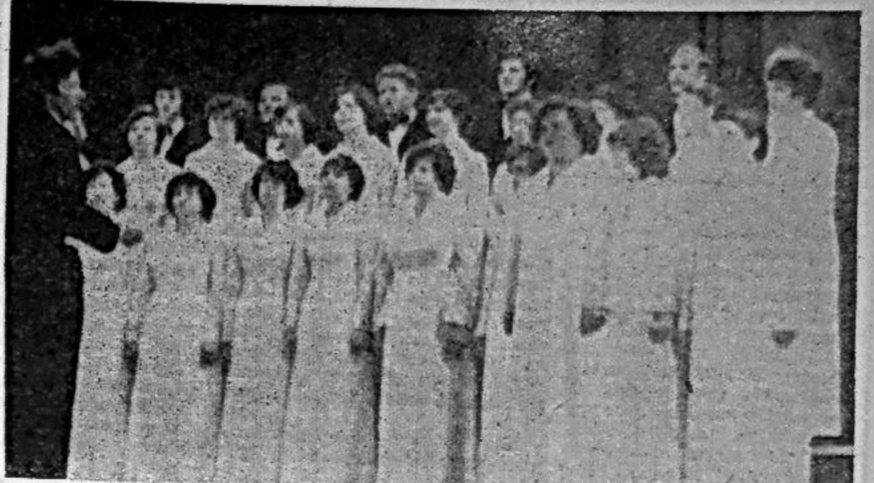
На снимке: выступает академический хор.

менее горячая пора для театральной студии. В работе находится спектакль «Святой и грешный» по пьесе Варфоломеева, готовится к очередному краевому смотру ВИА «Эксперимент», продолжают занятия в коллективах художественной самодеятельности Дворца культуры «Энергетик». В. ЦАРЕВА, художественный руководитель КПК.