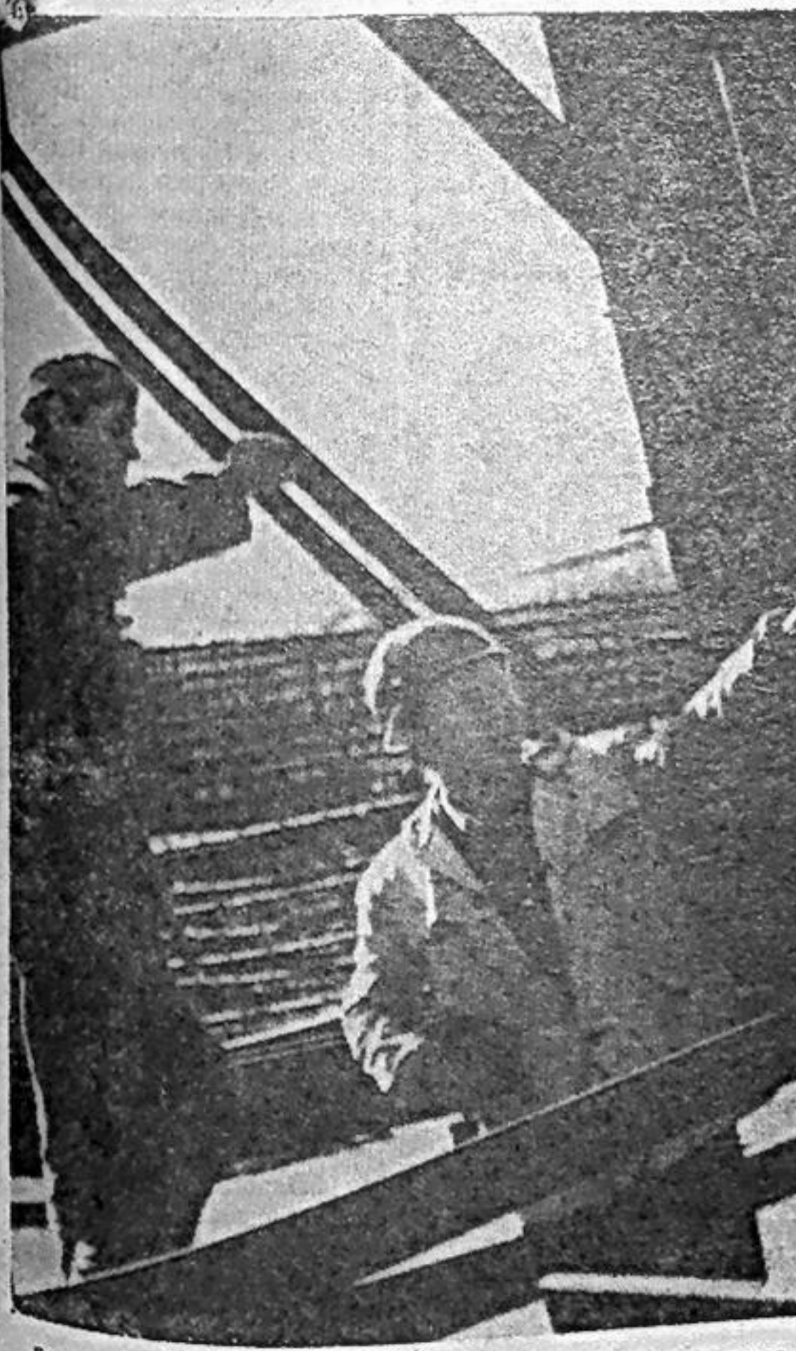
База Гидромонтажа — идет монтаж оборудования.