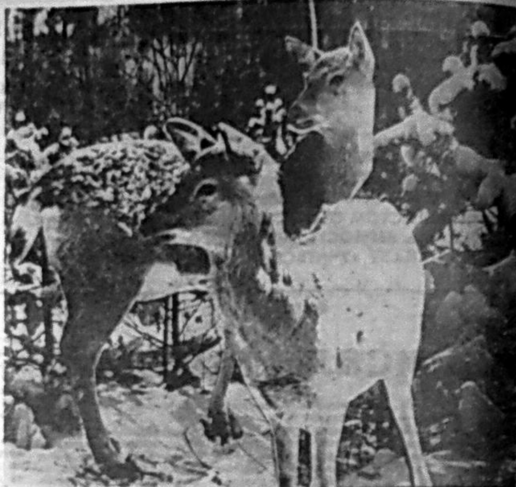
В ТАЙГЕ САЯНСКОЙ ВЫРОСЛИ.

С моей тревожной думой о лесах И с болью о лесах, что жжет все чаще, Я, в сущности, все время на весах, На липкой от смолы зеленой чаше. Я — на весах. Со мной зверье и лес — Весь мир зеленый с лепетом и речью. Весы качнулись — явный перевес За человеком с дробью и картечью. У ног его, как вырванный язык, В траве сияет смоливая щепка. Тот человек к радужам не привык, Берется за дела плохие цепко. Я — на весах... Позиция слаба. Раним и беззащитен перелесок. В то время, как решается судьба, Я просто незначительный довесок. И плохо, что воинственности нет, И стыдно, что в лесу творят расправы. На тех весах останется мой след, Но дело в том, что рядом след кровавый.