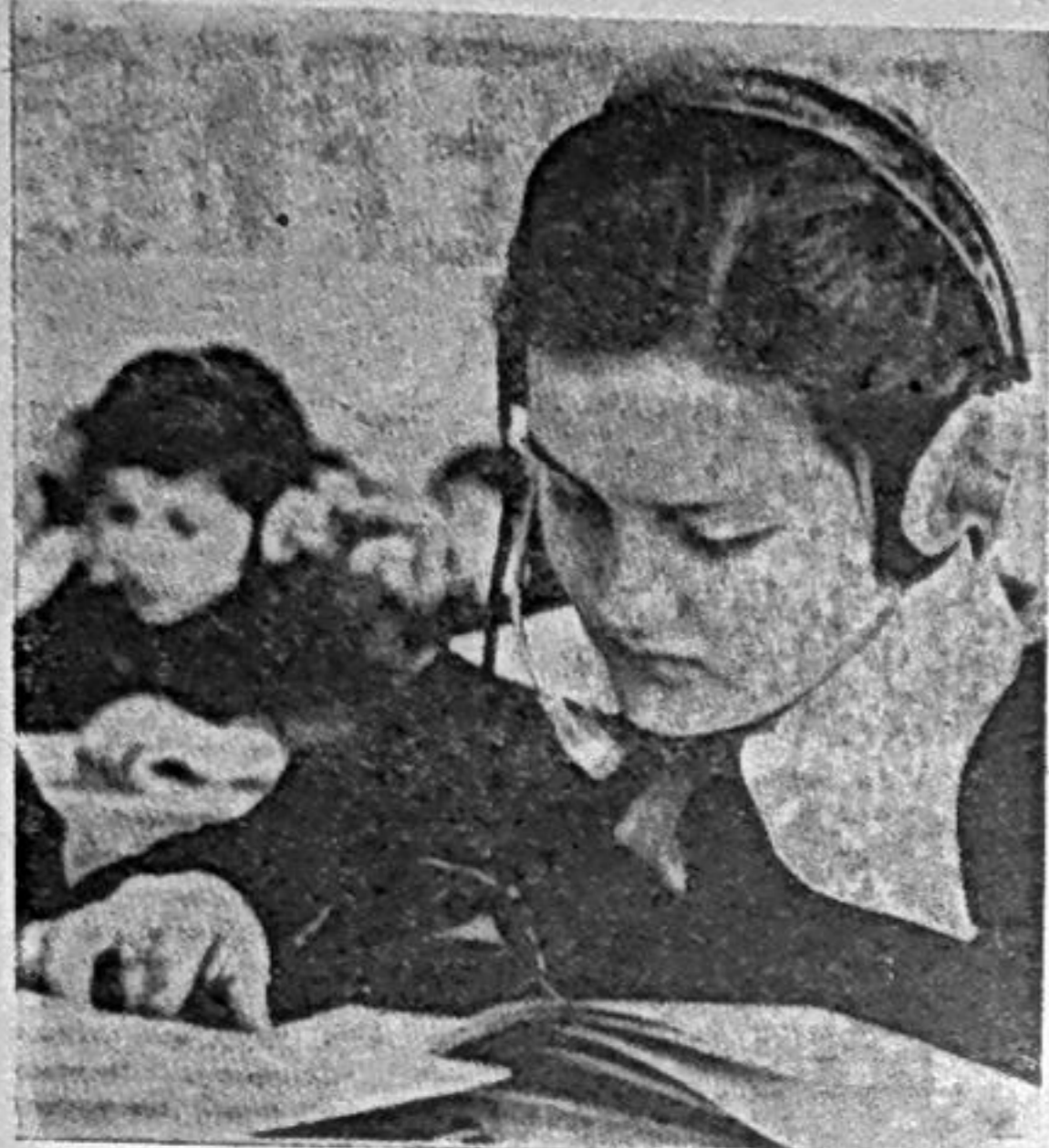
В Майнской средней школе оборудован специальный кабинет для занятий по иностранному языку. На снимке: на уроке.

19 МАЯ — ДЕНЬ РОЖДЕНИЯ ВСЕСОЮЗНОЙ ПИОНЕРСКОЙ ОРГАНИЗАЦИИ ИМЕНИ В. И. ЛЕНИНА.