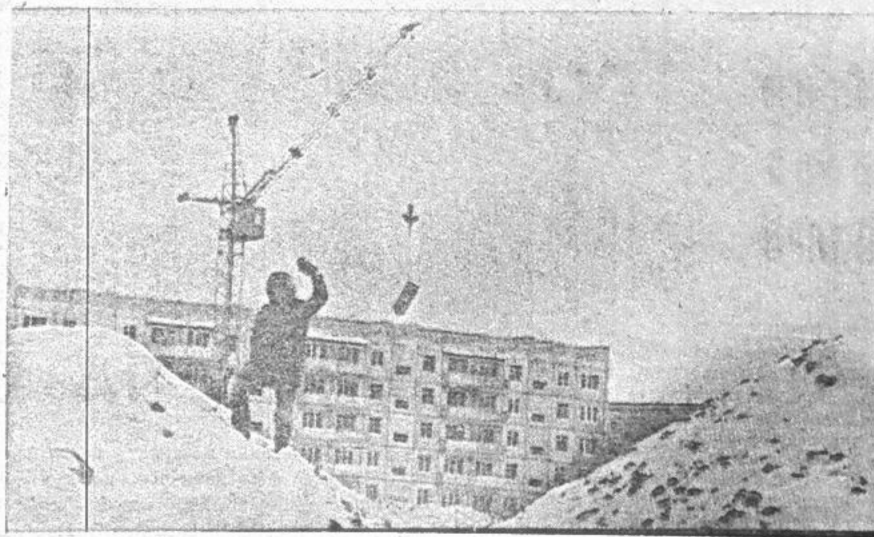
Строится молодой город.