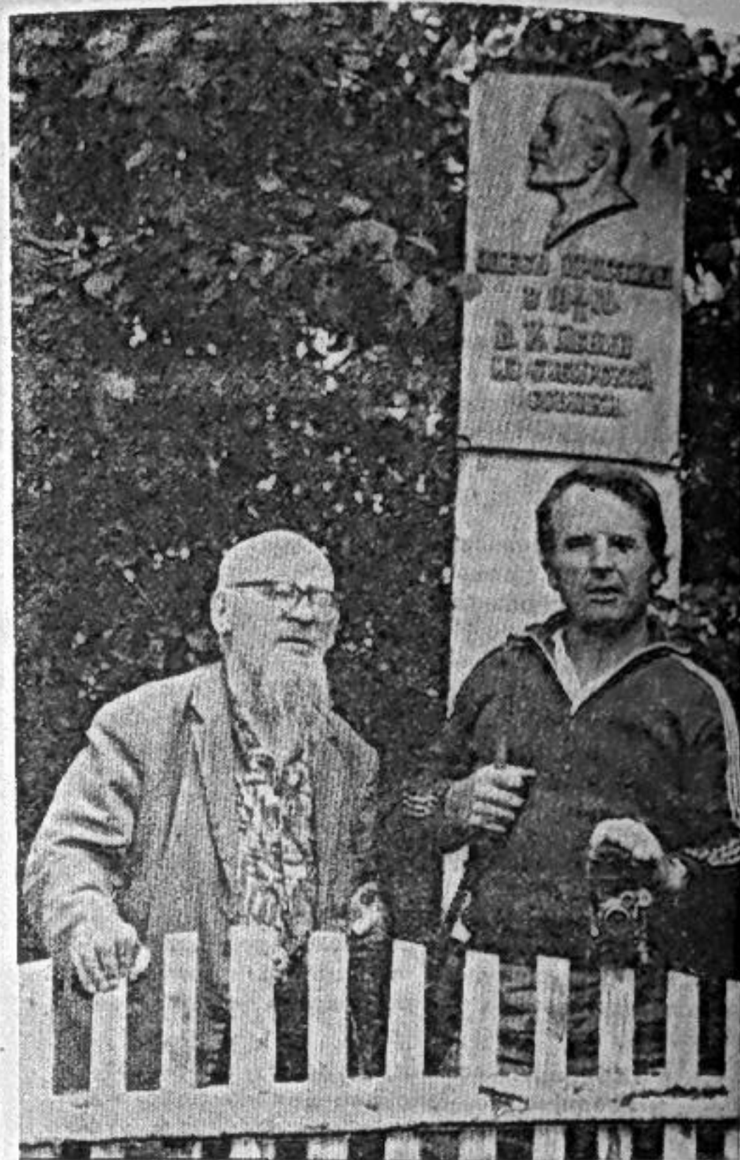
ПО ЛЕНИНСКИМ МЕСТАМ СИБИРИ

Помещаем снимок из серии «По ленинским местам Сибири». На снимке: деревня Серуль на старом Ачинск-Минусинском тракте. На установленной сте-