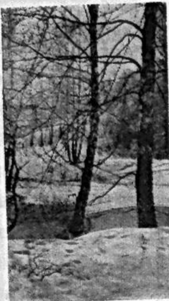
На лесной опушке.

Мечта и явь — почти границы нет... Такие за ночь выгорели строки, Хотя б быстрее приходил рассвет, Чтоб прочитать кому- нибудь на стройке. Илья КУЛЕШОВ.