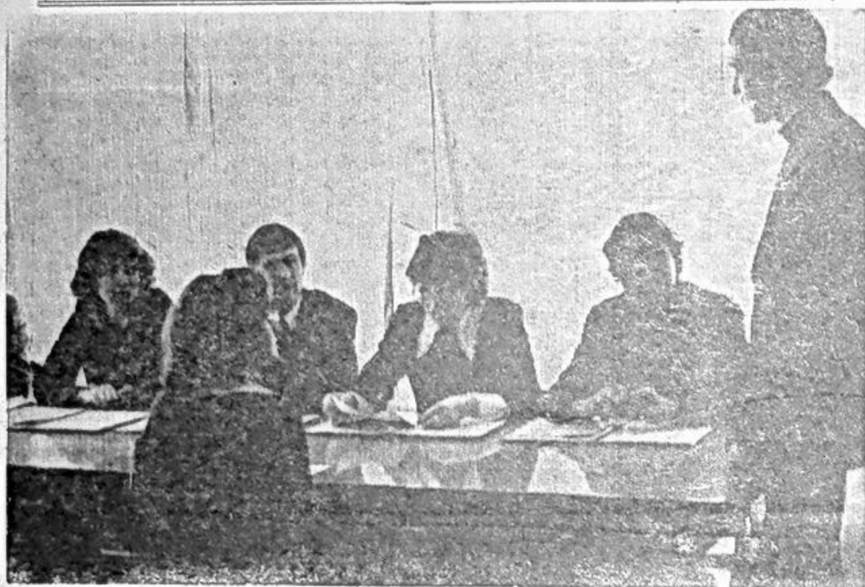
Саяногорский горком ВЛКСМ. Идет прием в комсомол.