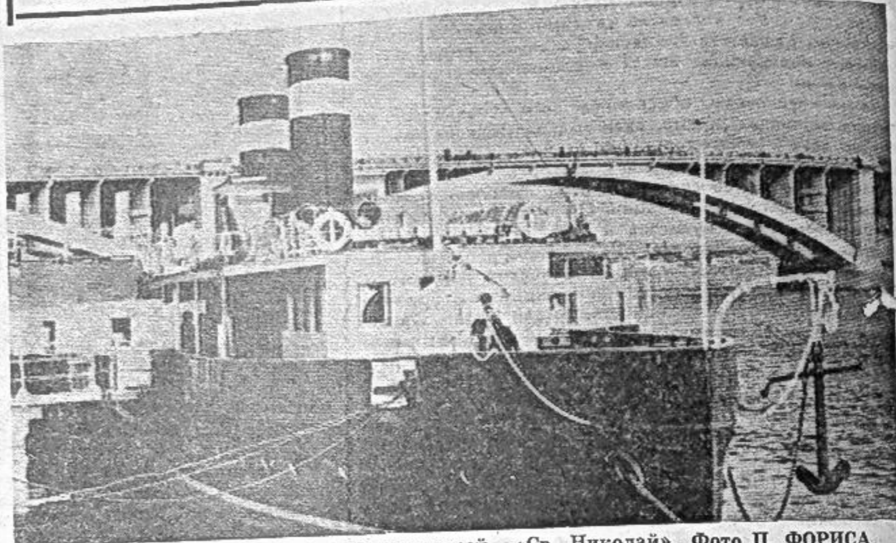
Красноярск, у причала пароход-музей «Св. Николай».

Кроме того, издано тридцать восемь ленинских сборников, десять томов биографической хроники Владимира Ильича, тематические сборники, избранные произведения и отдельные труды. Их тираж вместе с Полным собранием Сочинений составляет около 537 миллионов экземпляров. К 110-й годовщине со дня рождения вождя выходит тридцать девятый Ленинский сборник (ТАСС).