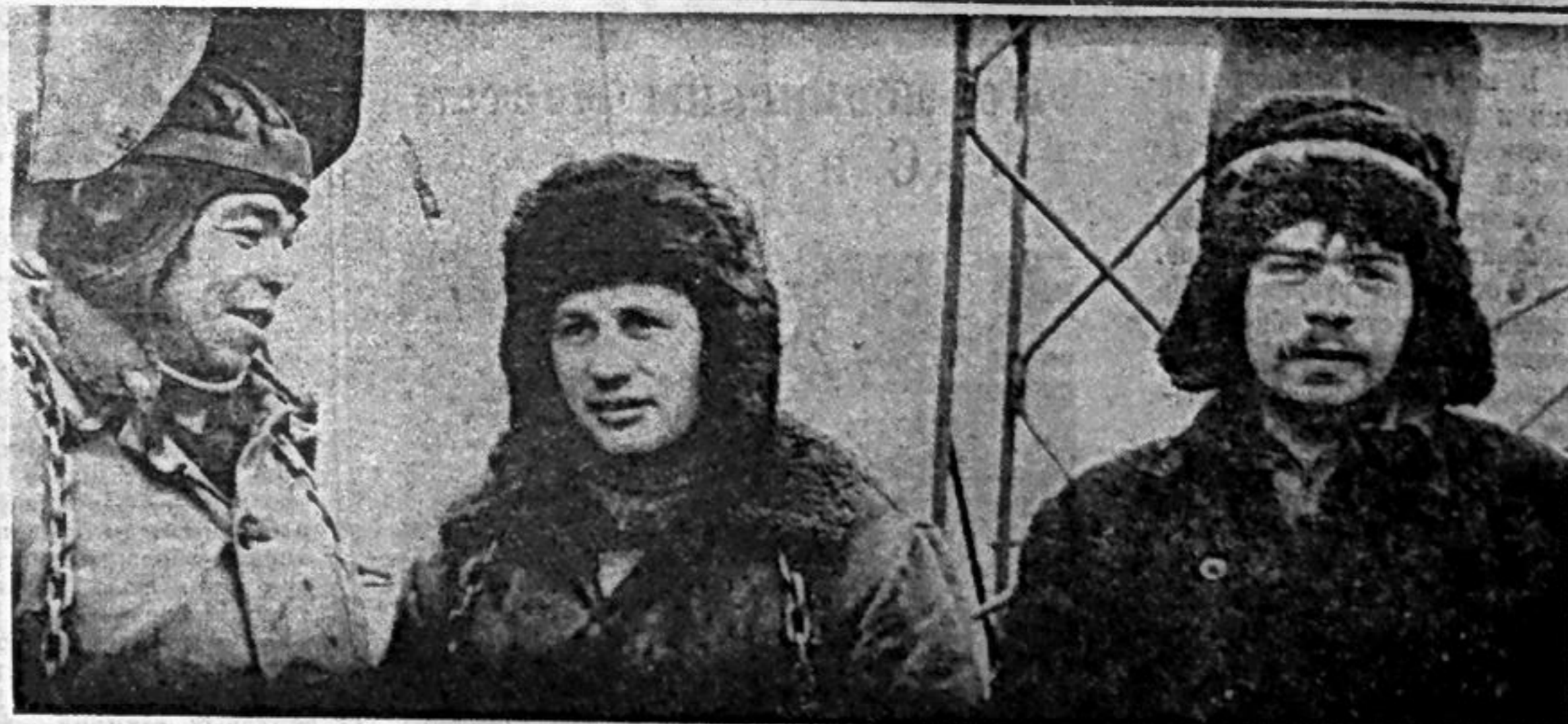
Приближение выборов в Советы, 110-я годовщина со дня рождения В. И. Ленина — все это по-особому открывает трудовые будни саяногорцев. Образцы ударной работы показывают на сооружении водо-