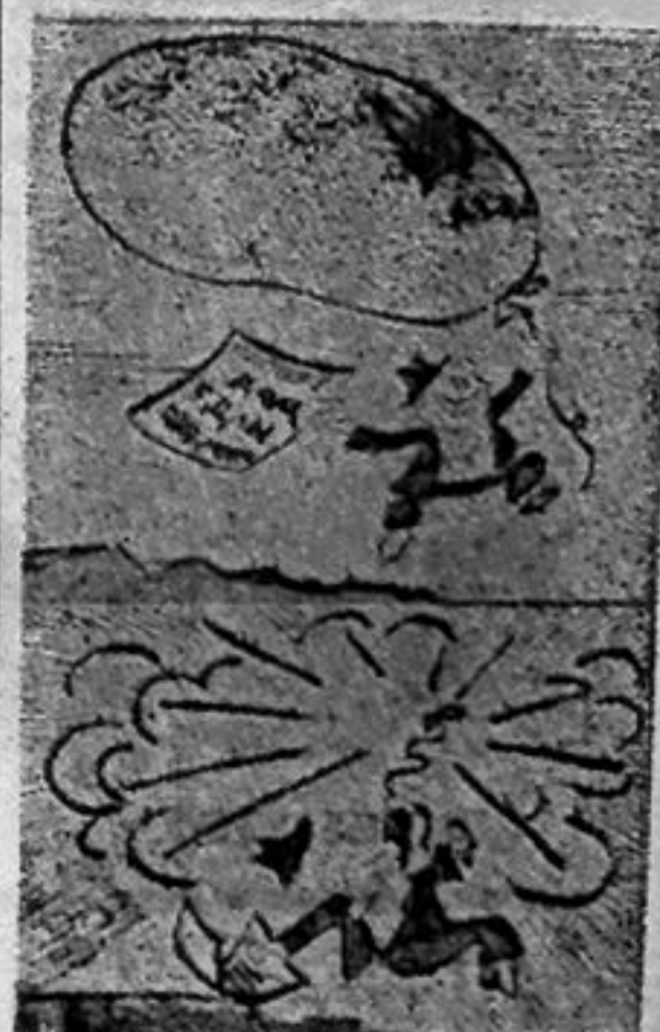
ДУТЫЙ ОТЧЕТ Рис. В. ПЕТРОВА.

Незаконченный дом исключен из годового отчета. Этот факт отрицательно скажется на материальном поощрении работников управленческого аппарата и линейного надзора за четвертый квартал 1979 года.