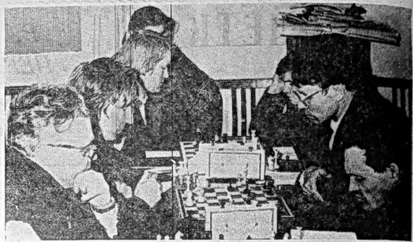
Большой популярностью среди саяногорцев пользуются шахматы. Недавно по этому виду спорта состоялось городское первенство. На снимке: шахматные баталии.

Наши библиотекари смогли увлечь своих читателей работой, привить им любовь к книге. Читателями являются не только дошкольники и учащиеся, но и педагоги, воспитатели детских садов. На протяжении десяти лет коллектив библиотеки находился в гуще общественной жизни поселка. Сейчас мы готовимся к встрече 110-й годовщины со дня рождения В. И. Ленина и 50-летия Хакасской автономной области. Оформлены иллюстрированные книжные выставки «Пусть жизнь великого вождя примером будет для меня», «На земле хакасской». Проводятся обзоры книг, беседы. В апреле будет проведен конкурс на лучшего читателя книг о В. И. Ленине. И. МИРОНОВА, библиотекарь.