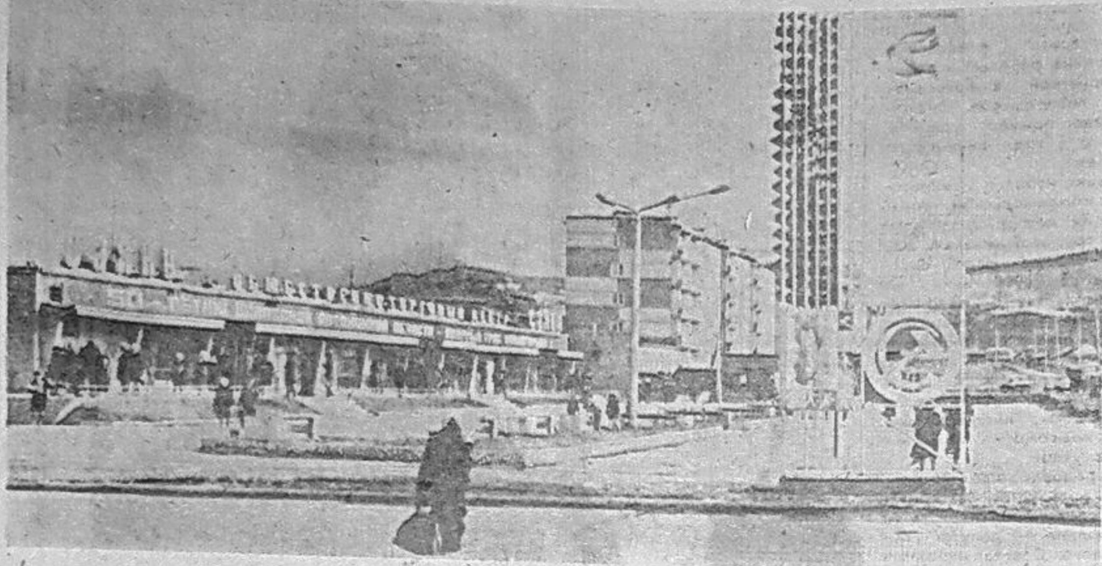
НАШ ГОРОД НА ЕНИСЕЕ — САЯНОГОРСК.