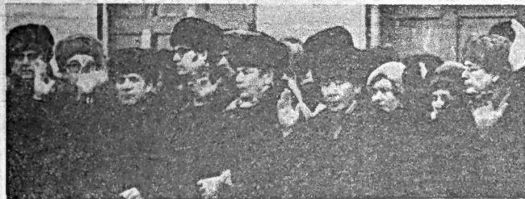
СаАЗ: на собрании по выдвижению кандидатов в депутаты.