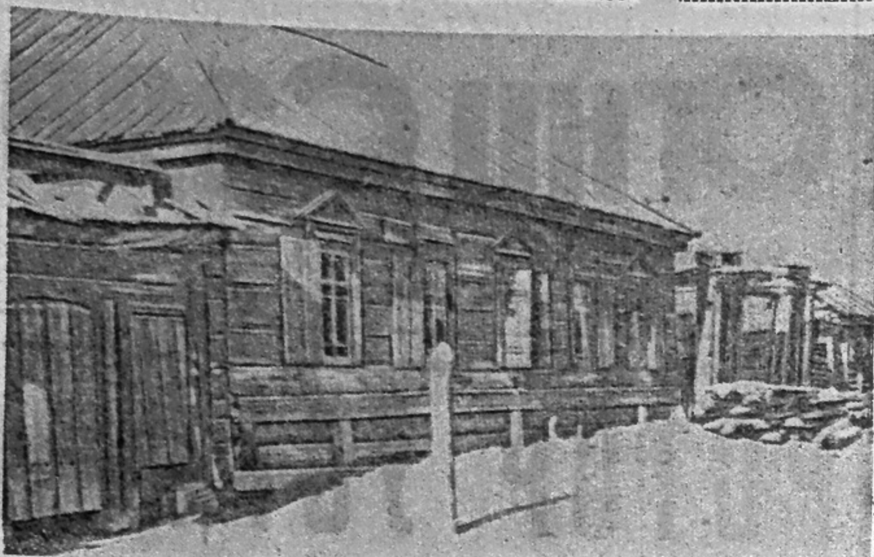
Дом в Шушенском, в котором жил во время ссылки В. И. Ленин.

В разделе «Из жизни коммунистических и рабочих партий» опубликована статья кандидата в члены Политбюро ЦК секретаря ЦК СЕПГ Хорста Долуса «Славное тридцатилетие ГДР».