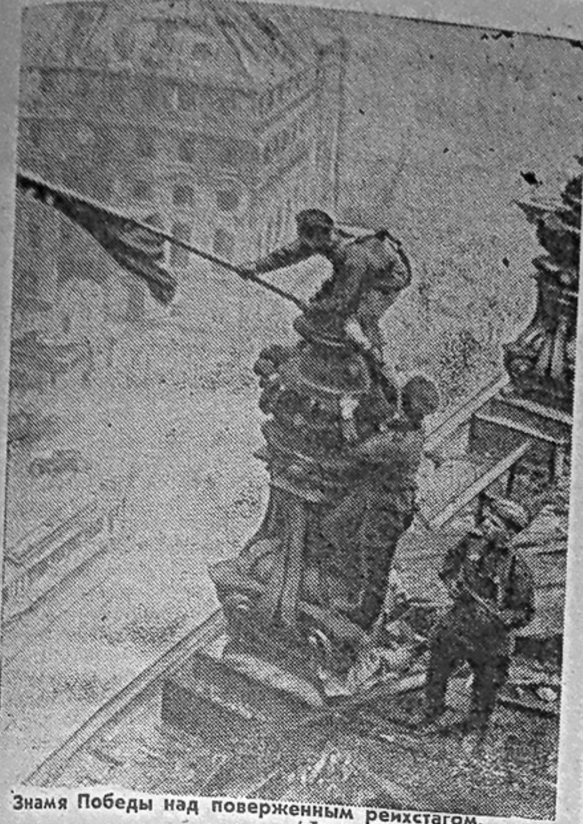
Знамя Победы над поверженным рейхстагом.