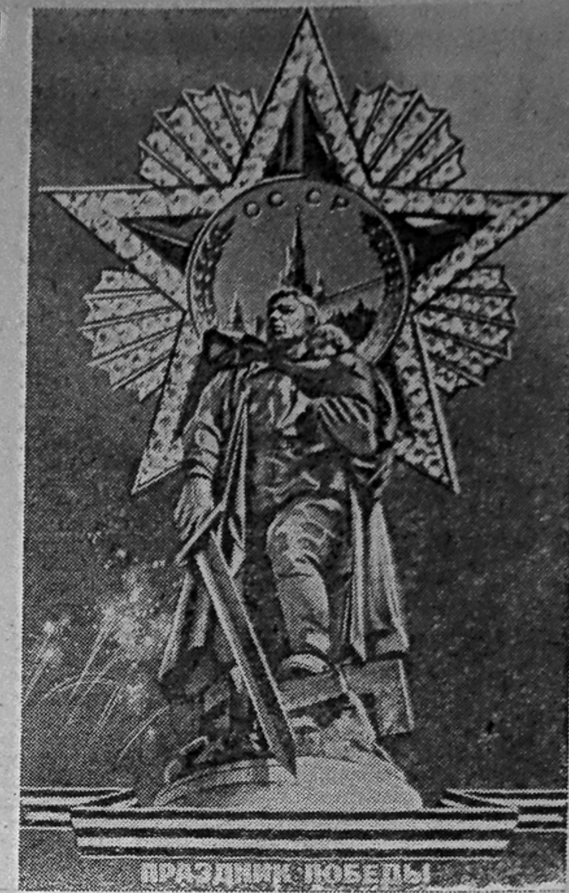
Плакат художника В. Викторова. Издательство «Плакат».

Ударным, самоотверженным трудом советские люди достойно ознаменовали 60-ю годовщину первого коммунистического субботника, названного В. И. Лениным Великим почином. Они с энтузиазмом работали в промышленности, в сельском хозяйстве, на транспорте, в строительстве и других отраслях народного хозяйства, а также на благоустройстве городов и населенных пунктов и своим