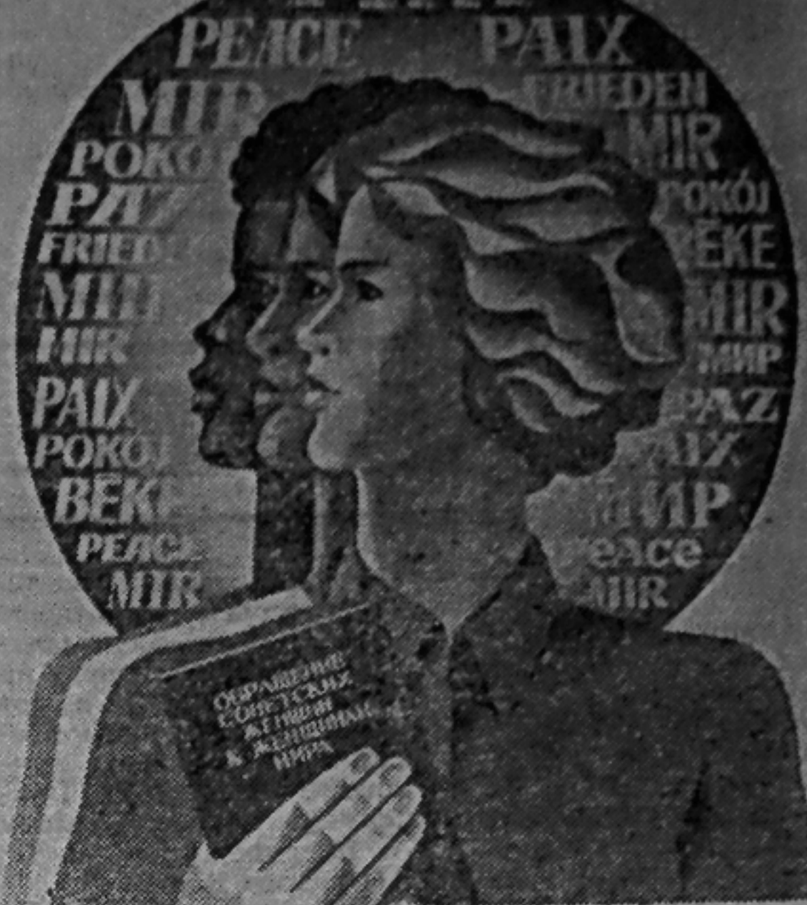
Плакат художника М. Гетмана «Женщины мира! Крепите единство в борьбе за мир!» Издательство «Плакат».