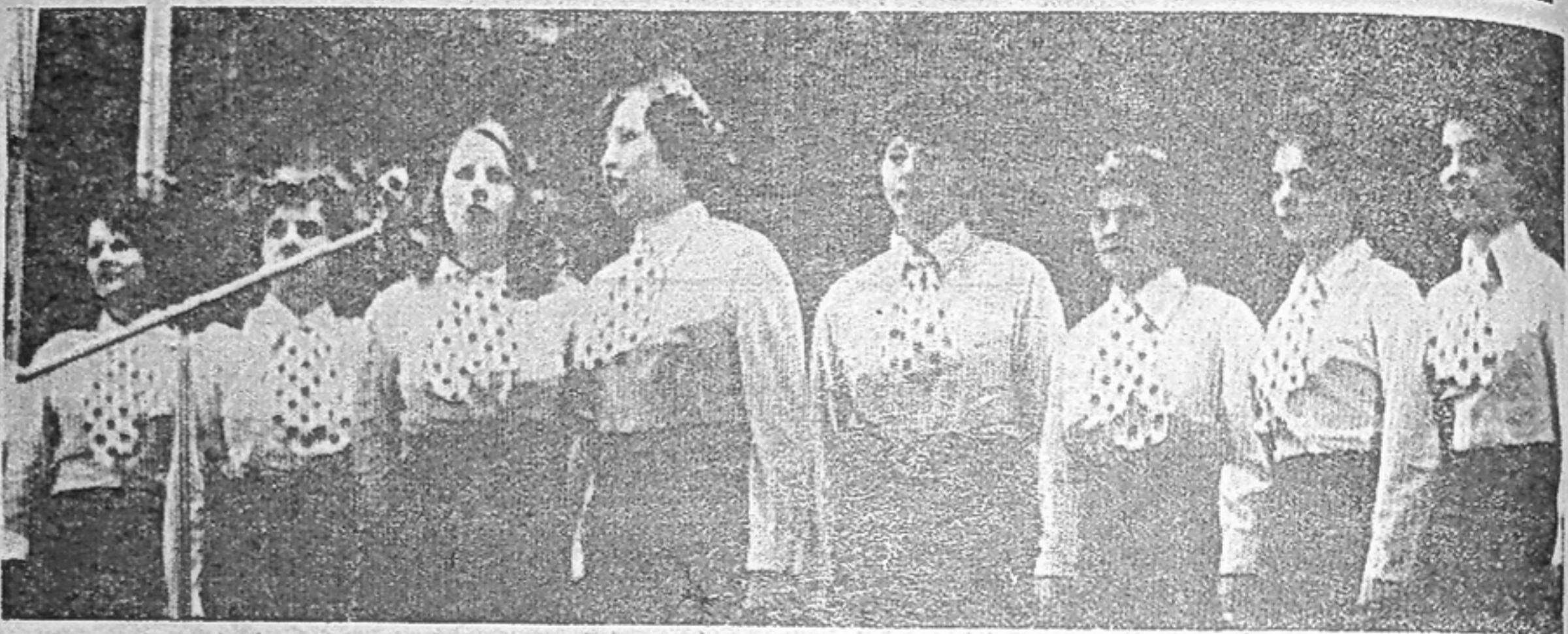
УЧАСТНИКИ ХУДОЖЕСТВЕННОЙ САМОДЕЯТЕЛЬНОСТИ г. САЯНОГОРСКА.

Надеемся, что все хорошие начинания найдут поддержку у общественности города, у населения.