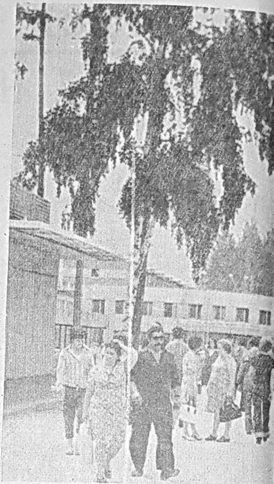
В ПОСЕЛКЕ ЧЕРЕМУШКИ.