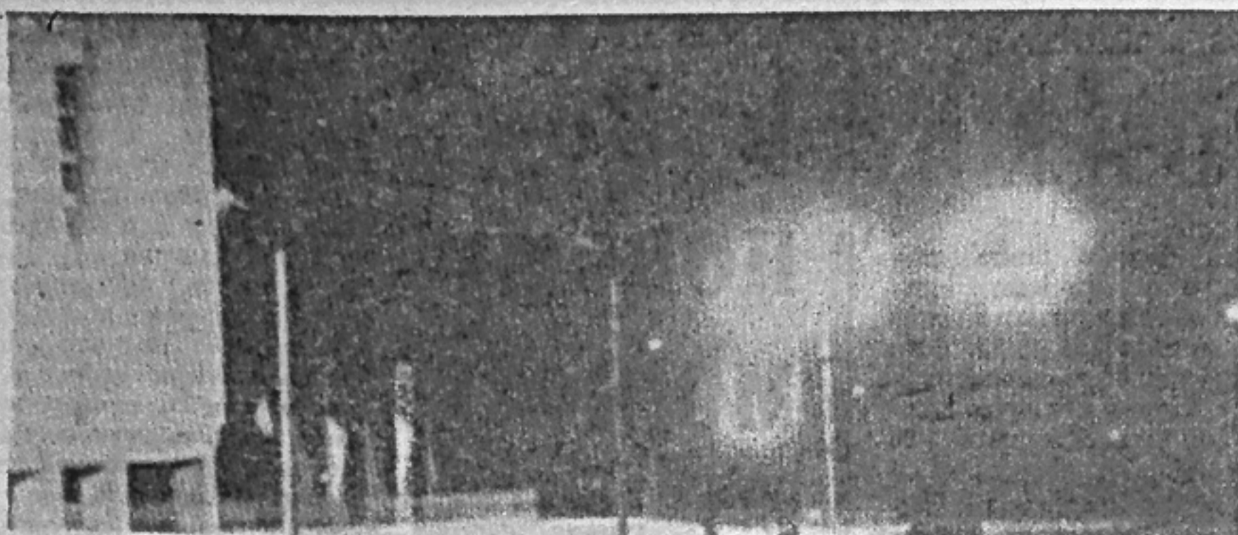
Вечерние огни поселка.

В ДК «Энергетик» в 20 часов — сводный концерт танцевального коллектива «Стругураш», ансамбля «Арион» и агиттеатра «Данко».