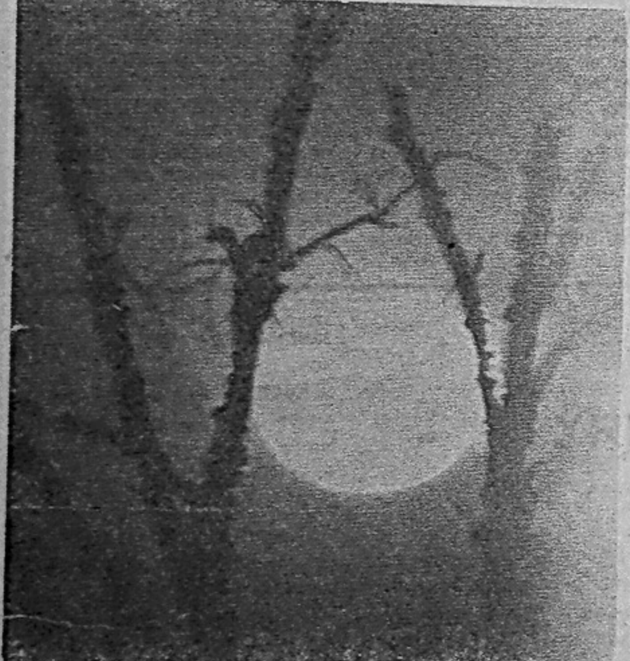
ЛУННЫЙ ПЕЙЗАЖ. Фото М. Штыгашева.