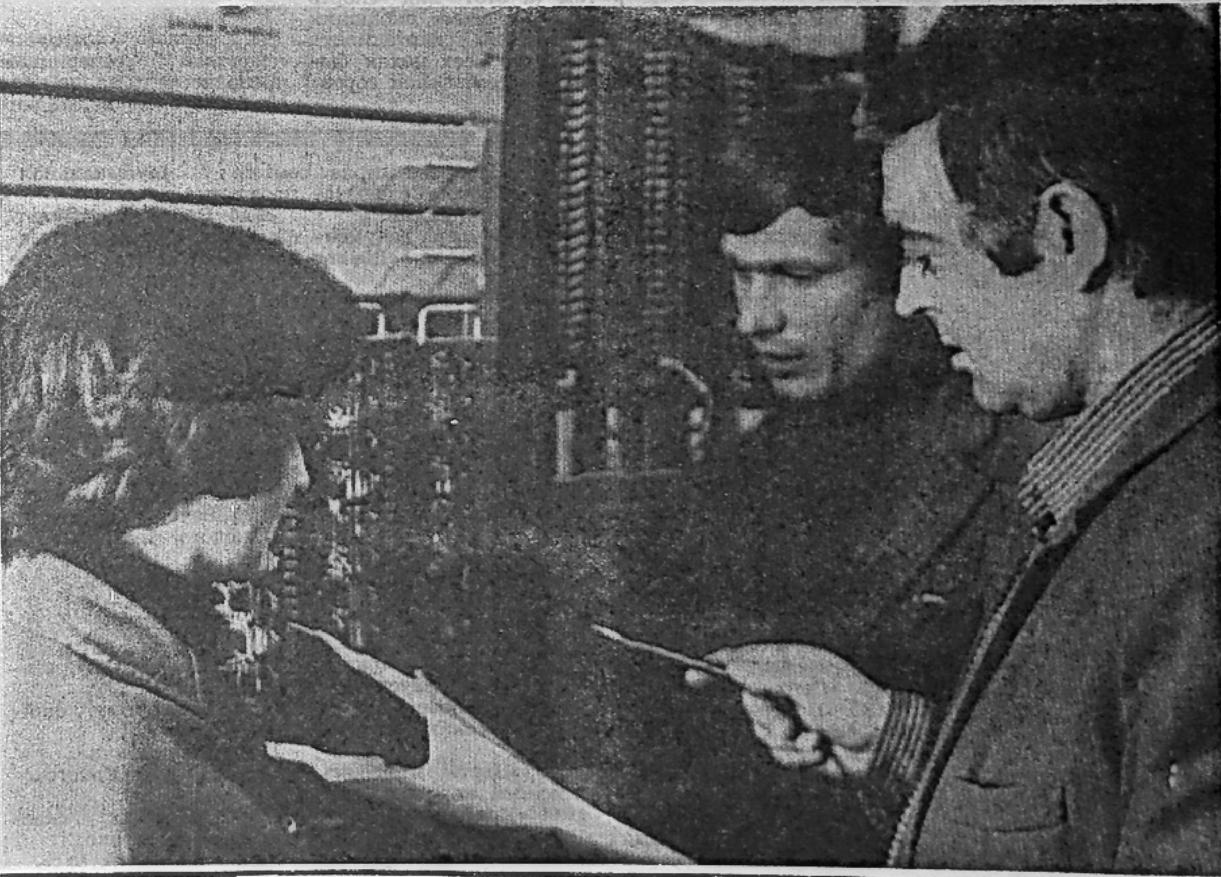
• КОМБИНАТ «САЯНПРАМОР»