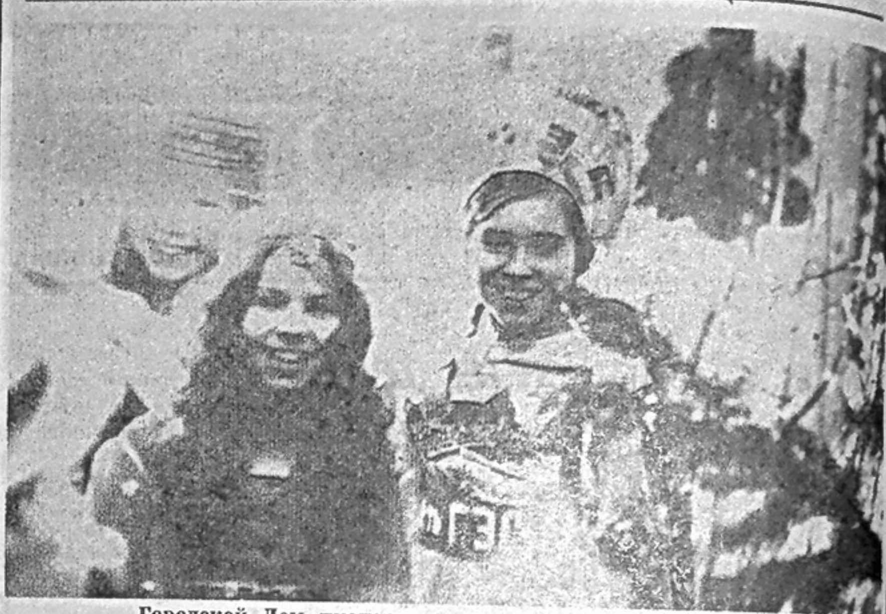
Городской Дом пионеров: на новогодней елке.