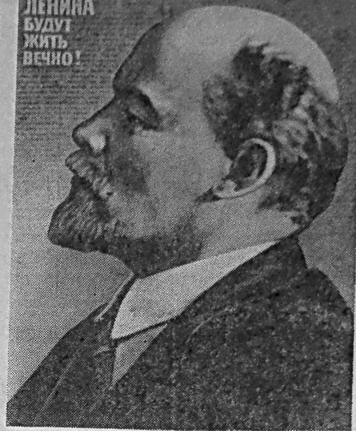
Плакат художника Б. Бerezовского. Издательство «Плакат».