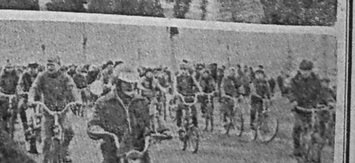
Фоторепортаж с первомайской демонстрации в Саяногорске Б. Анатольева и В. Городецкого.