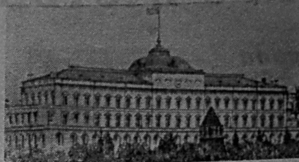
Москва. Большой Кремлевский дворец.