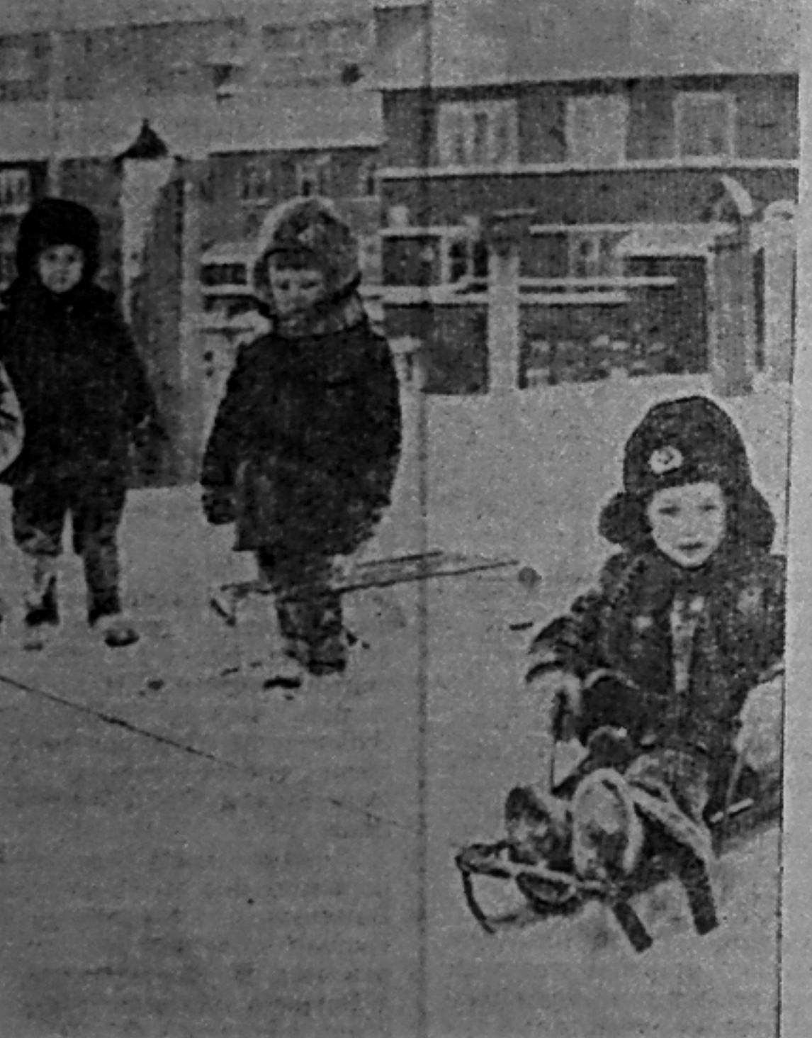
ЗАМЕЧАТЕЛЬНО В ЗИМНИЙ ПОГОЖИЙ ДЕНЕК ПОКАЗАТЬСЯ НА САНКАХ, А ЗИМА В ЭТОМ ГОДУ ВЫДАЕТСЯ СНЕЖНОЙ.

На снимке: детвора на прогулке.