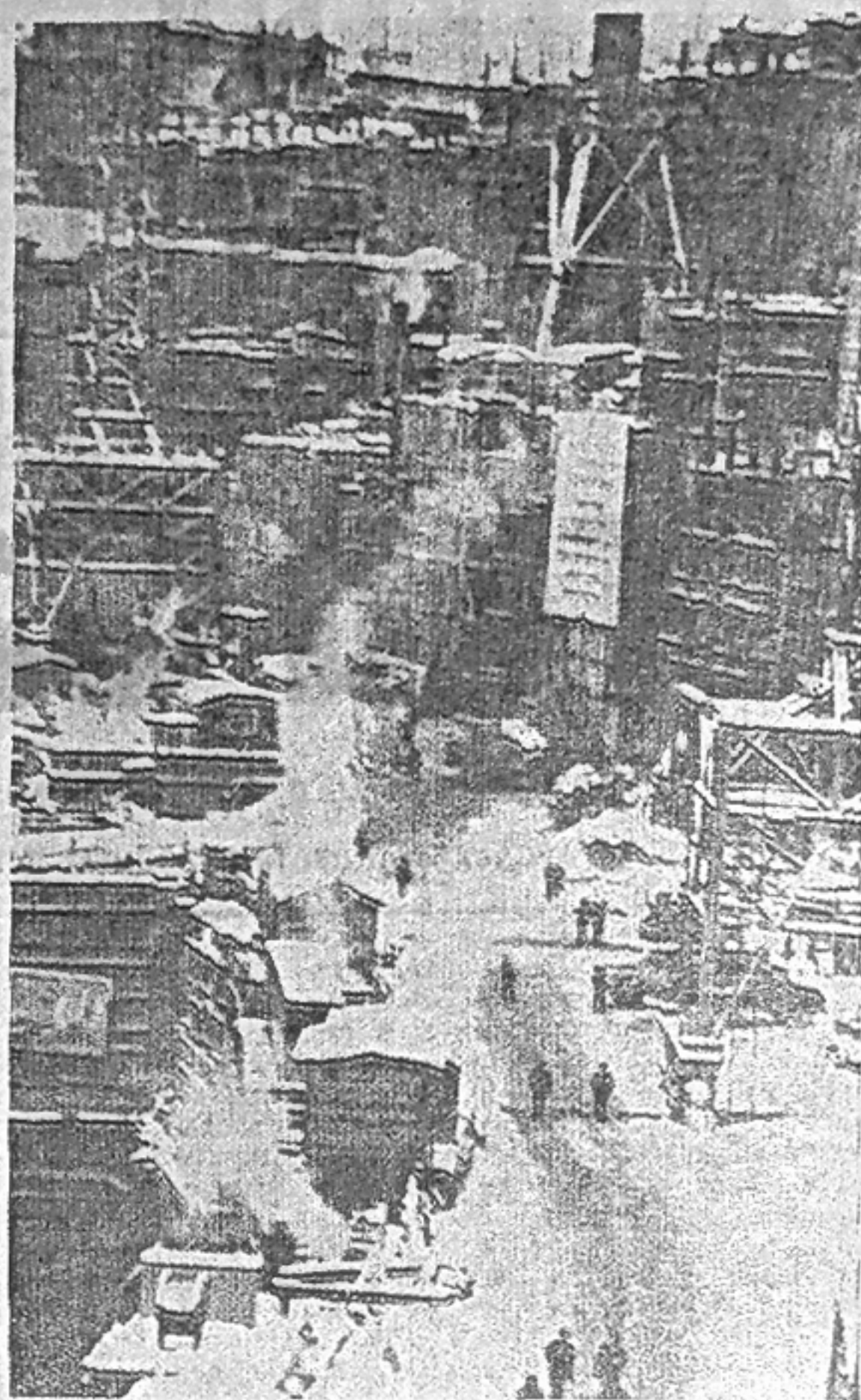
ГЭС: ВАХТА ПРОДОЛЖАЕТСЯ.