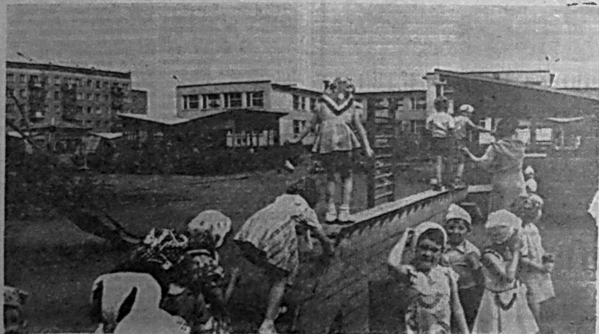
● В ДЕТСКОМ САДУ «РЯБИНКА».

*** Управлению строительства Саянпрогражданстрой срочно требуются машинистки для работы в машбюро на постоянную и временную работу. Обращаться в отдел кадров, тел. 3-55 п. Майна. (3-1).