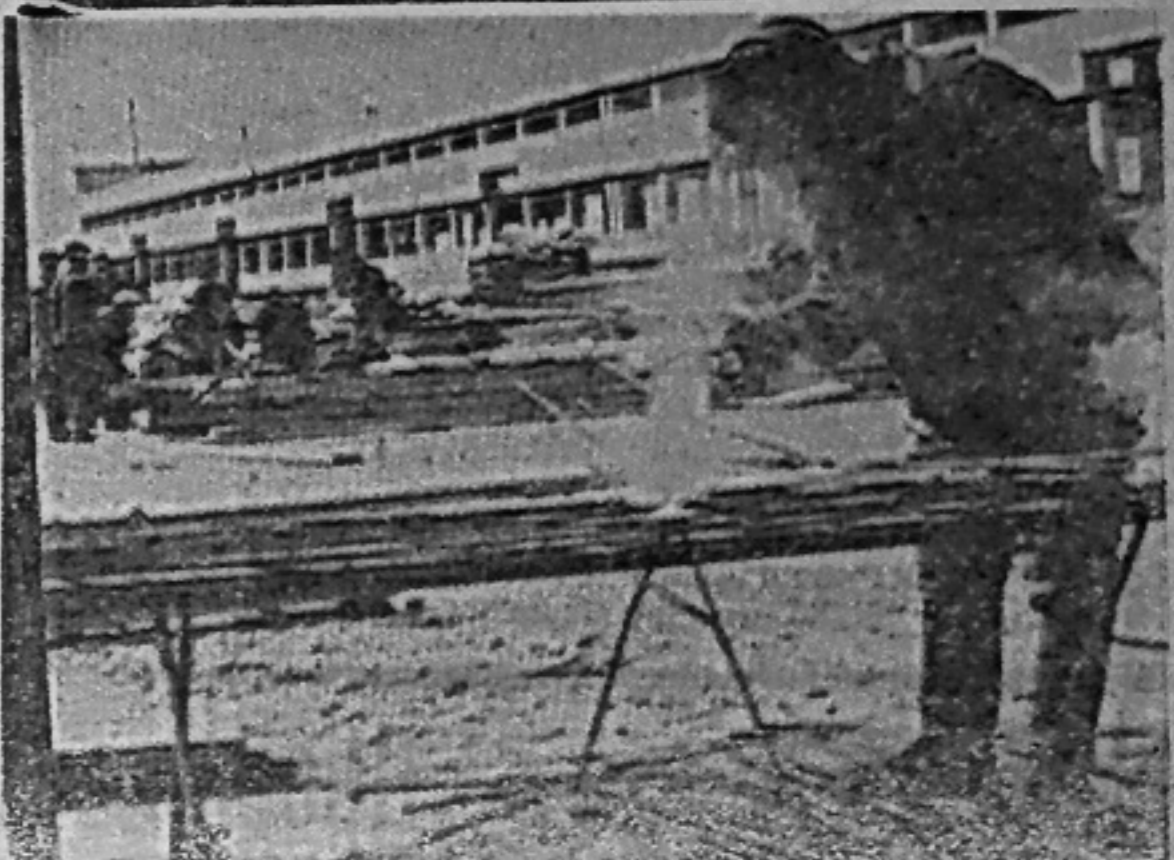
На строительстве СаАЗа.