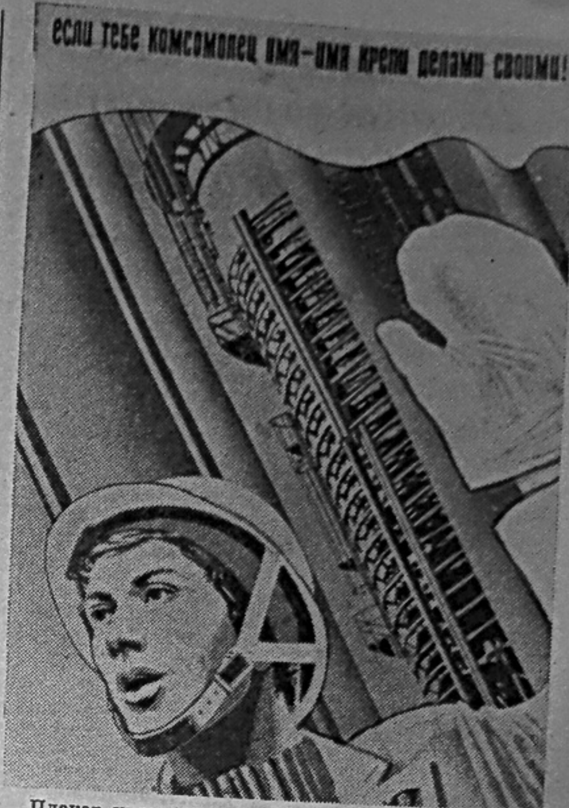
Плакат художника А. Якушина «Если тебе комсомолец имя — имя крепи делами своими!» Издательство «Плакат».

По обсужденному вопросу принята резолюция.