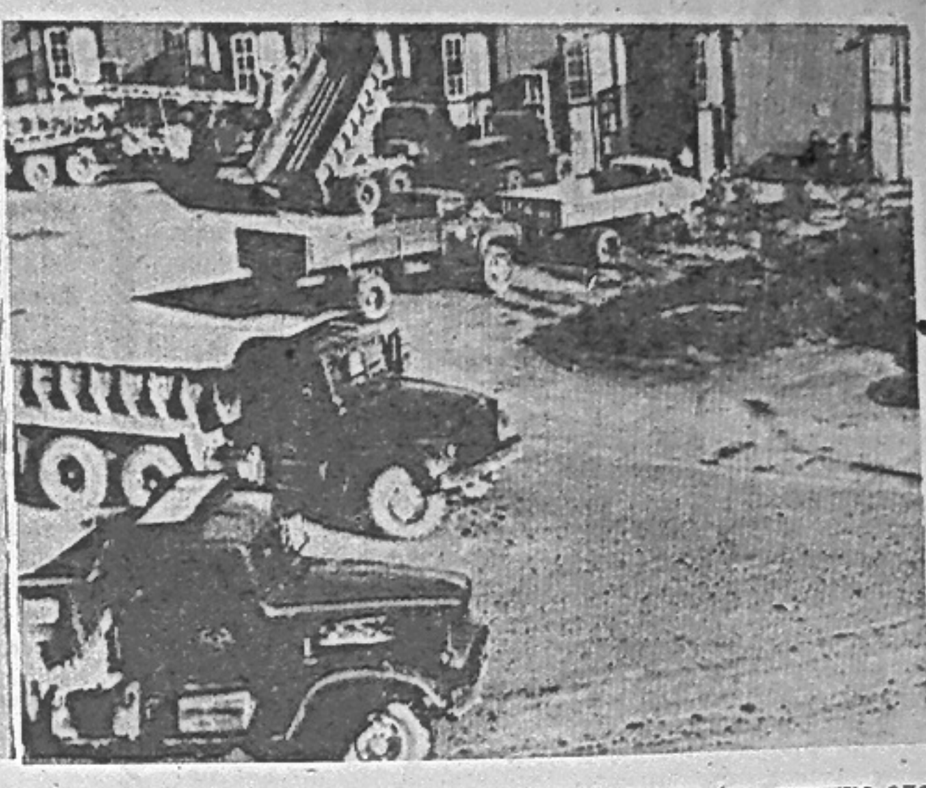
...нократный победитель соревнования (на снимке слева). На снимке справа: перед рабочей сменой.