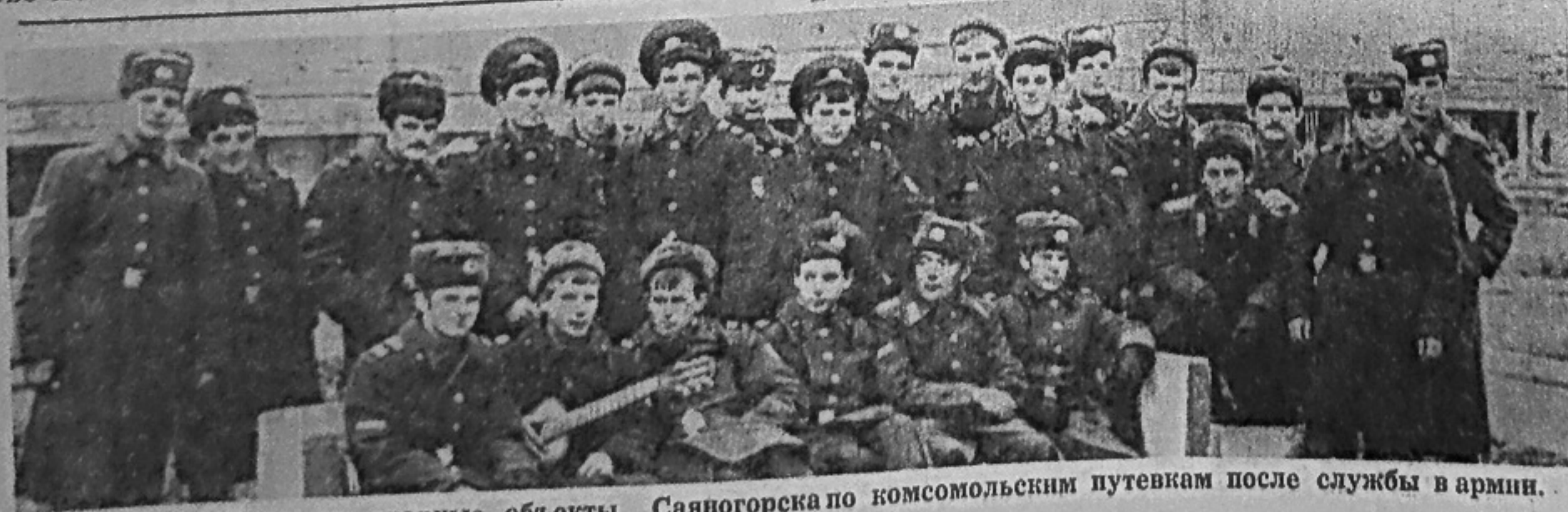
Они прибыли на ударные объекты Саяногорска по комсомольским путевкам после службы в армии.