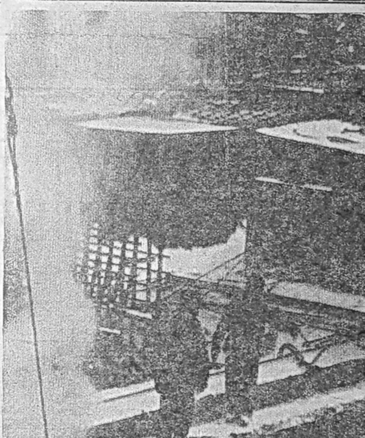
На строительстве ГЭС.