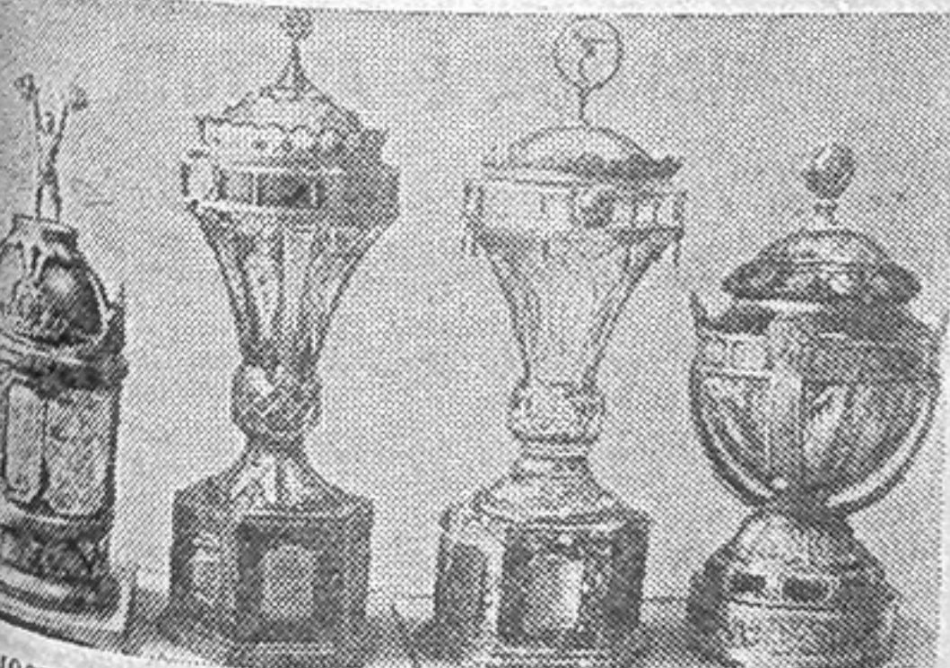
МОСКВА. Свыше ста призов учреждено для участников VII летней Спартакиады народов СССР. Среди них «За высшее спортивное мастерство», «За рекордные результаты», «Олимпийские надежды», а также призы различных общественных организаций, газет и журналов.

Это красочные кубки работ известных мастеров Гжели, Хохломы, Палеха, а также изделия знаменитого Дулевского завода.