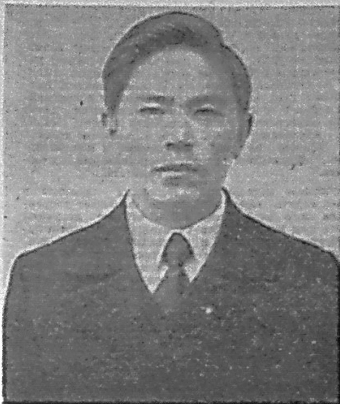
Выполняя указания партии об усилении воспитательной работы молодежи и повышении ответственности руководителей всех производственных и служебных звеньев, руководство Саяногор-

Неблагополучие в семье отрицательно сказывается на характере развития ребенка. Анализ за 1978-79 год показал, что из подростков, совершающих преступления и правонарушения, 65 процентов проживают в неполных и неблагополучных семьях.