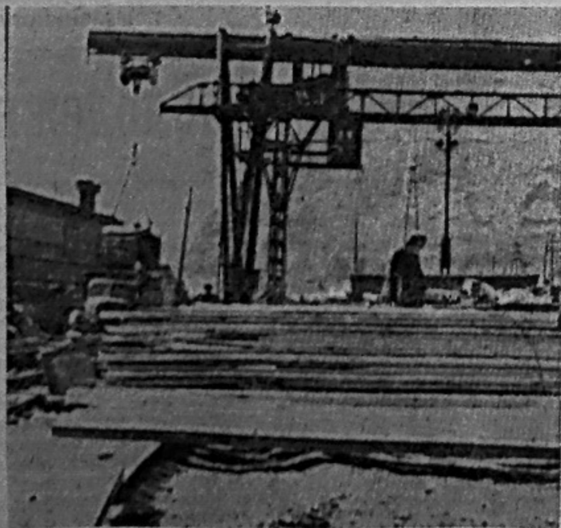
На снимках: монтажная площадка (ДОЗ); погрузка инертных на гравзаводе.