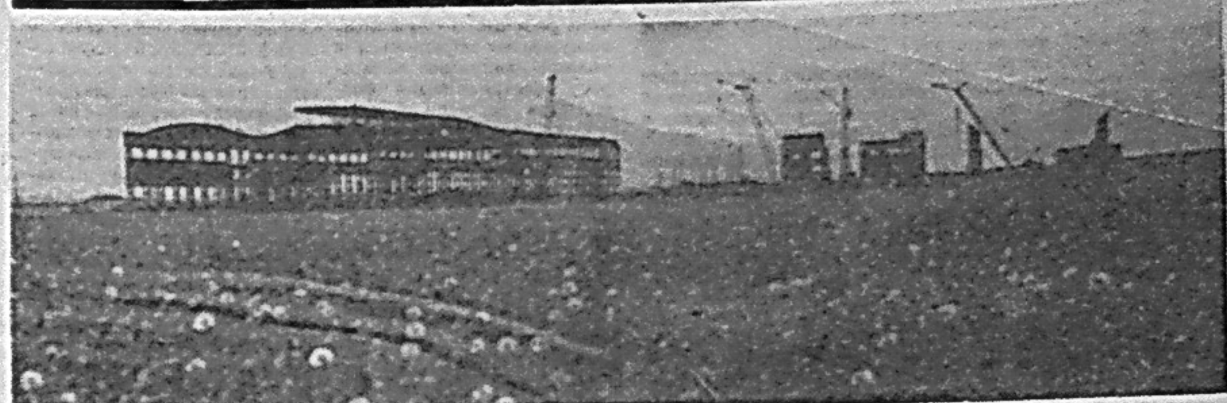
Расширяется фронт работ на Саянском алюминиевом заводе. На снимках растут в стены корпуса.