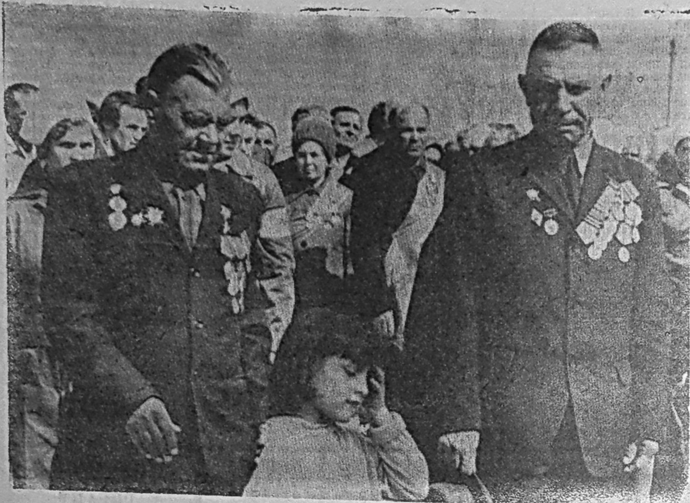
На снимке: ветераны войны.

7 мая в г. Георгию-Деж приехали ветераны 309-й Пирятинской Краснознаменной, ордена Кутузова II степени стрелковой дивизии, началом боевого пути которых была лискинская земля.