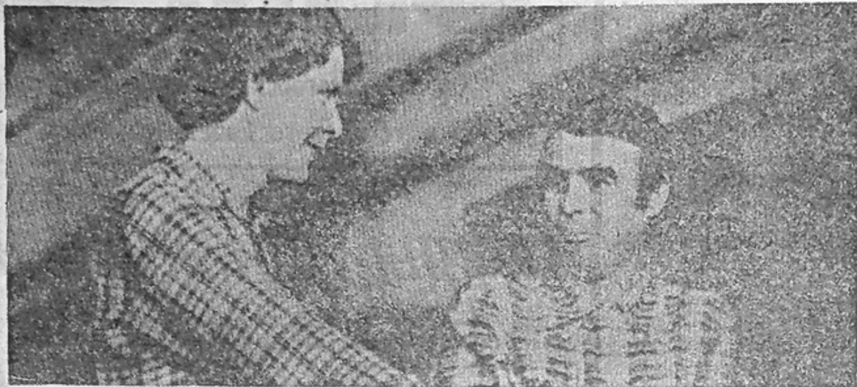
Молодежь АТК-2 Красноярскгэсстрой встречает праздник — День советской молодежи новыми трудовыми успехами. Водители обеспечивают доставку бетона на основные сооружения гидроузла, своевременно перевозят срочные грузы для стройки.

Большая заслуга в обеспечении бесперебойной работы автотранспорта принадлежит в эти дни ремонтникам АТК-2. Это они своим ударным трудом обеспечивают выход машин на линию.