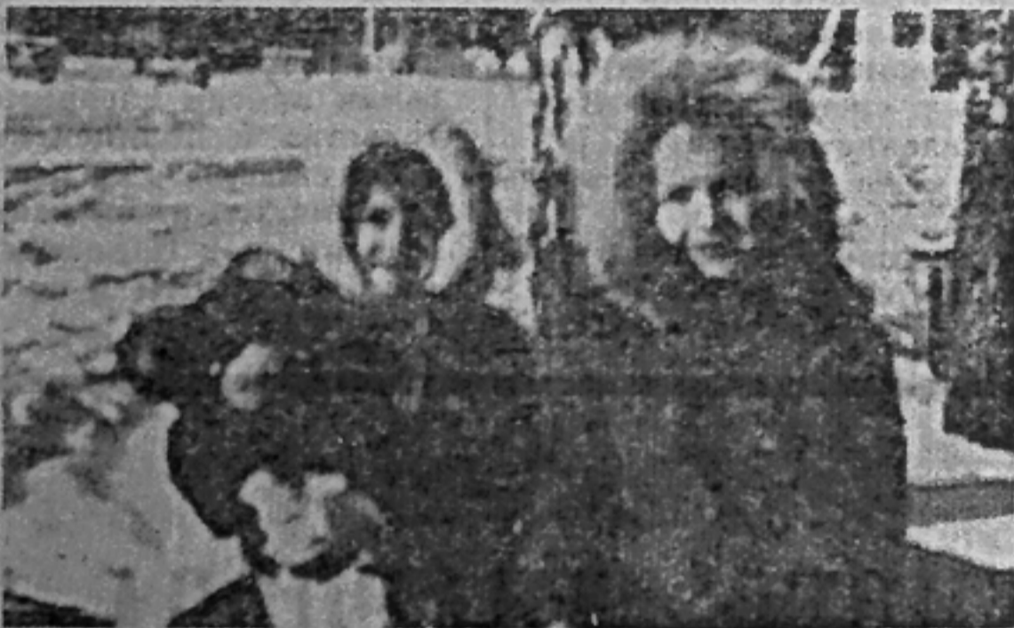
ПОДРУЖКИ.