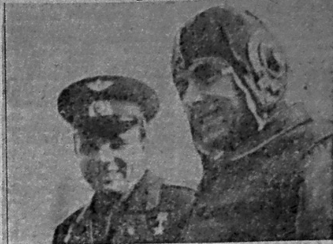
Летчики-космонавты СССР: Герой Советского Союза Юрий Алексеевич Гагарин и дважды Герой Советского Союза Владимир Михайлович Комаров (справа).