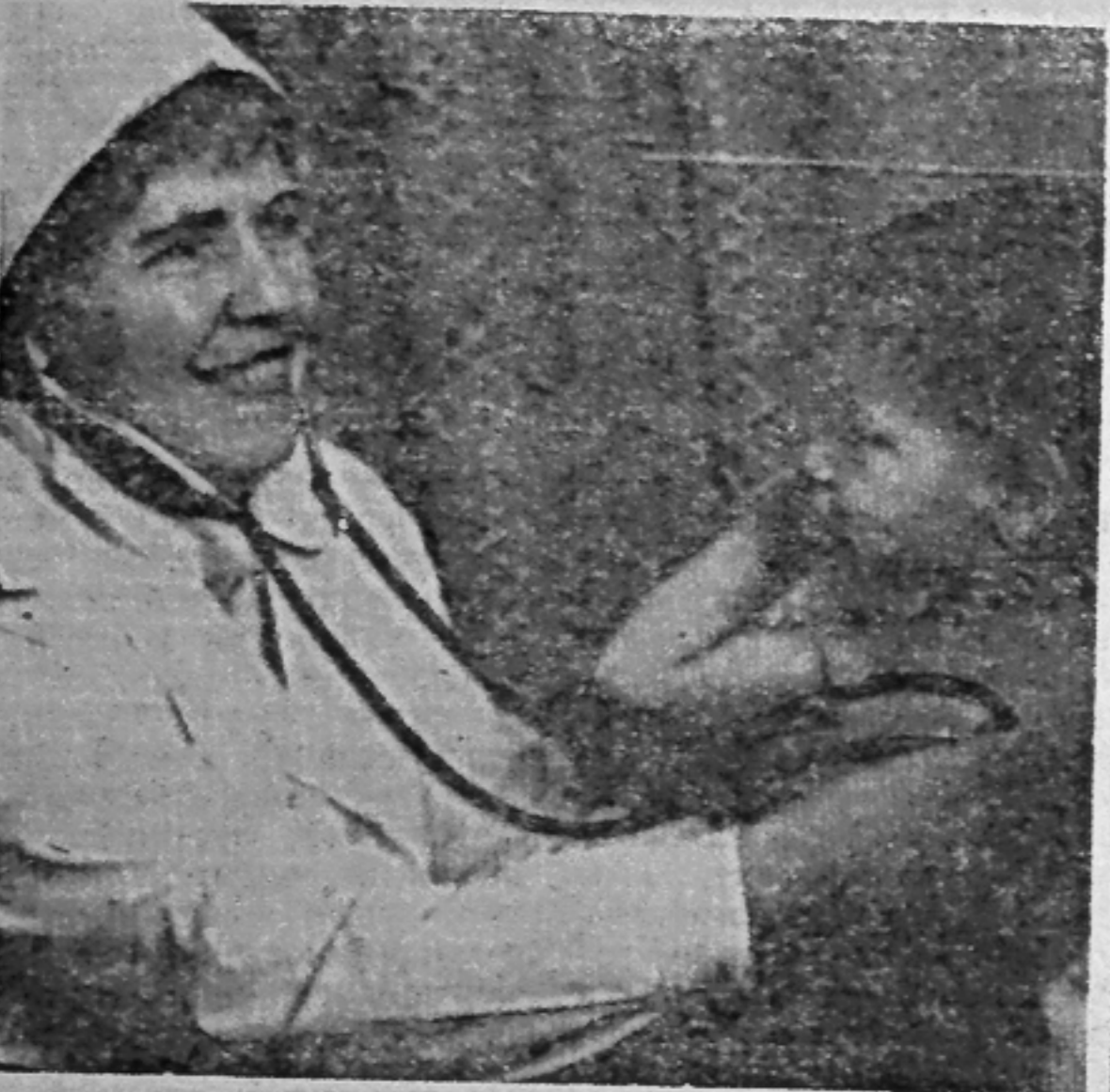
• ЛЮДИ В БЕЛЫХ ХАЛАТАХ

А 8 февраля, в день памяти юных героев — антифашистов во всех школах состоялись митинги. ...Замерли отряды, а из репродуктора голос: «Слушайте, слушайте, гудит со всех сторон. Это раздается в Бухенвальде колокольный звон...» Взметнулись над головами лозунги, транспаранты: «Мы не хотим войны!», «Детям Земли нужен мир!», «Нет нейтронной бомбе!». На русском, немецком, ан-