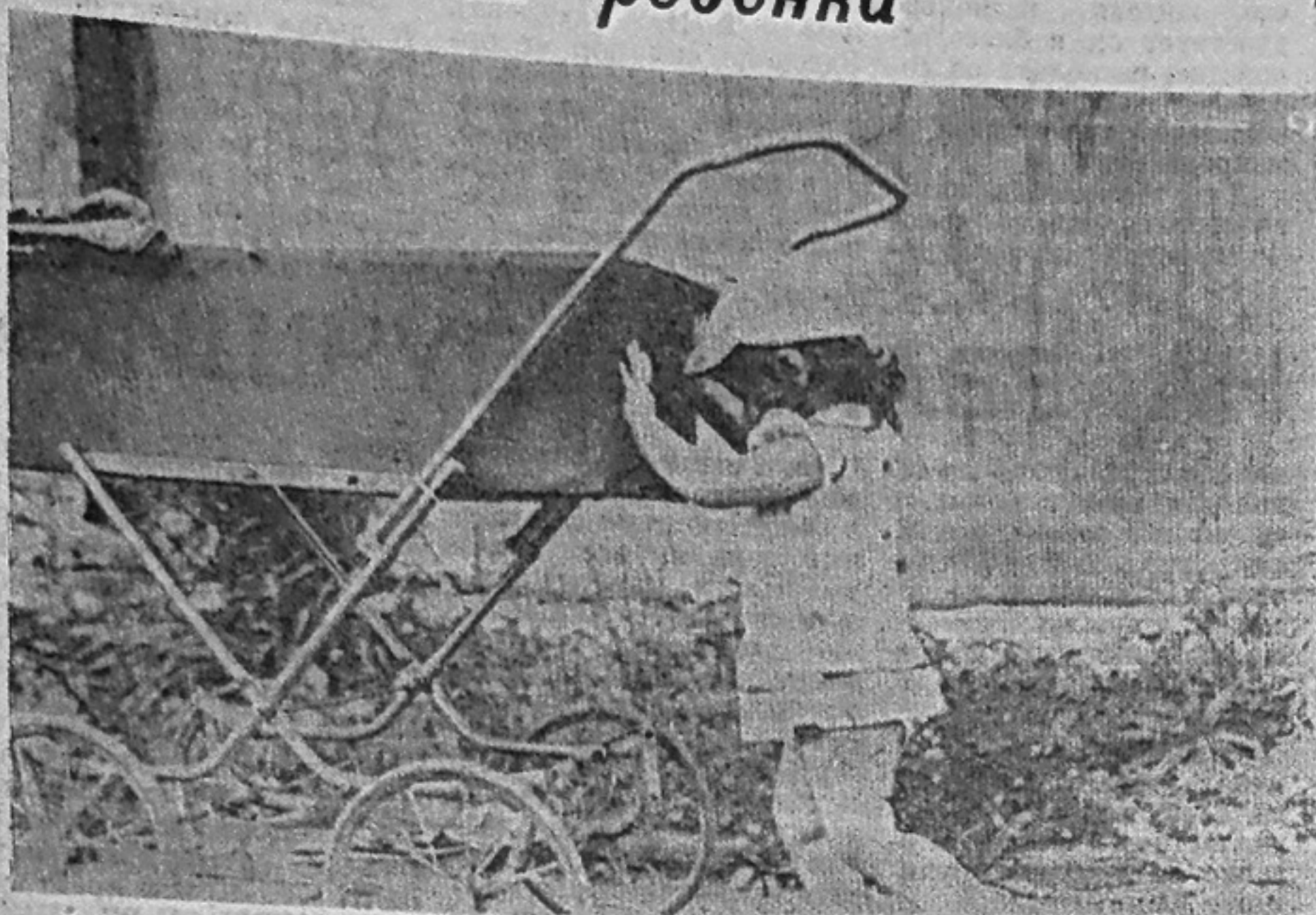
Все свое вожу с собой.