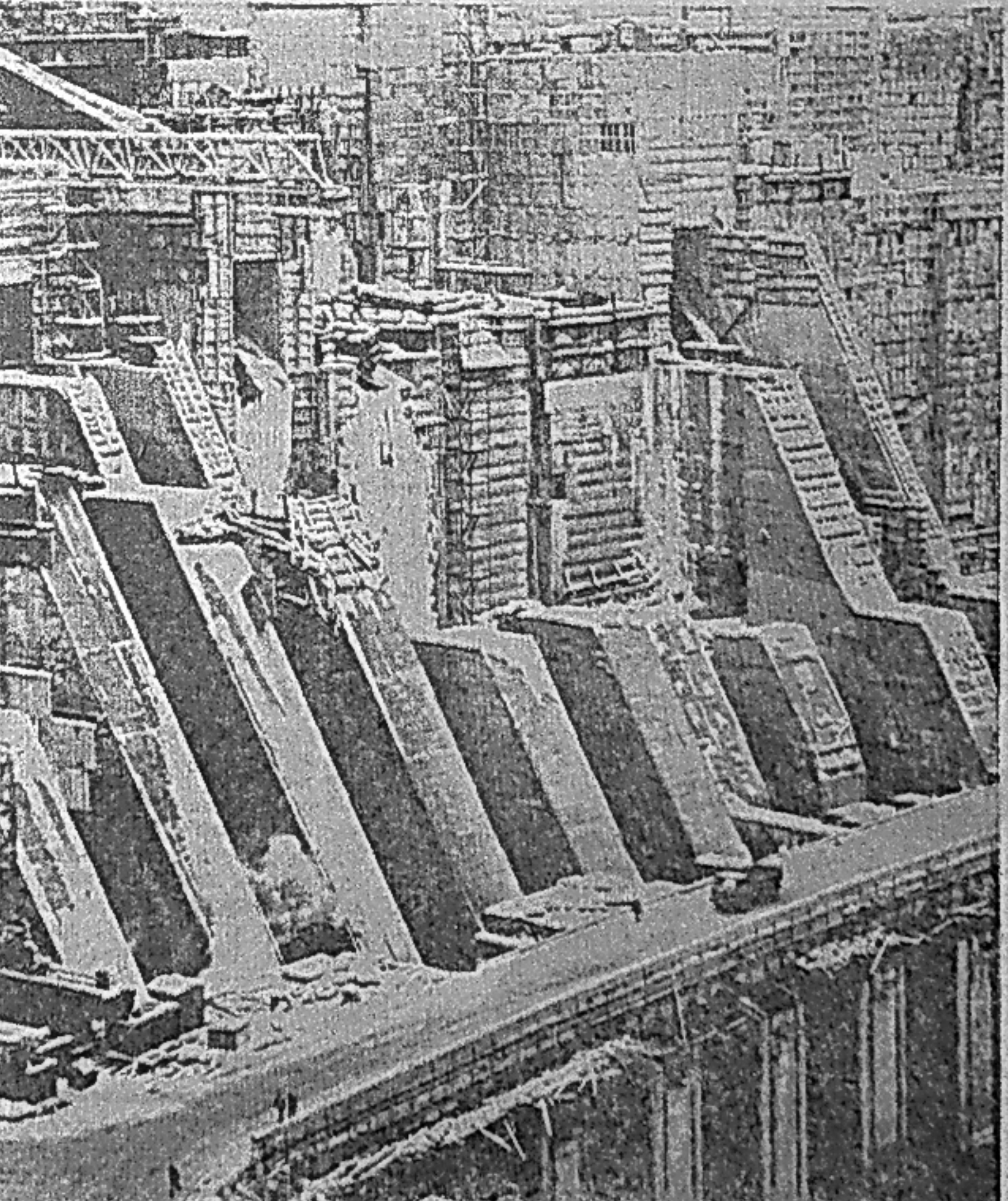
НА ОСНОВНЫХ СООРУЖЕНИЯХ ГЭС.

Коллективу основных сооружений необходимо до паводка обеспечить подъем первых и вторых столбов плотины. При развертывании соревнования между бригадами, выполняющими эту работу, следует использовать накопленный опыт малого содружества. Для того, чтобы обеспечить надежную работу трех гидроагрегатов в весенне-летний паводок, коллективу СУЗГЭС, ГМ, ГЭМ надо выполнить до июня ком-