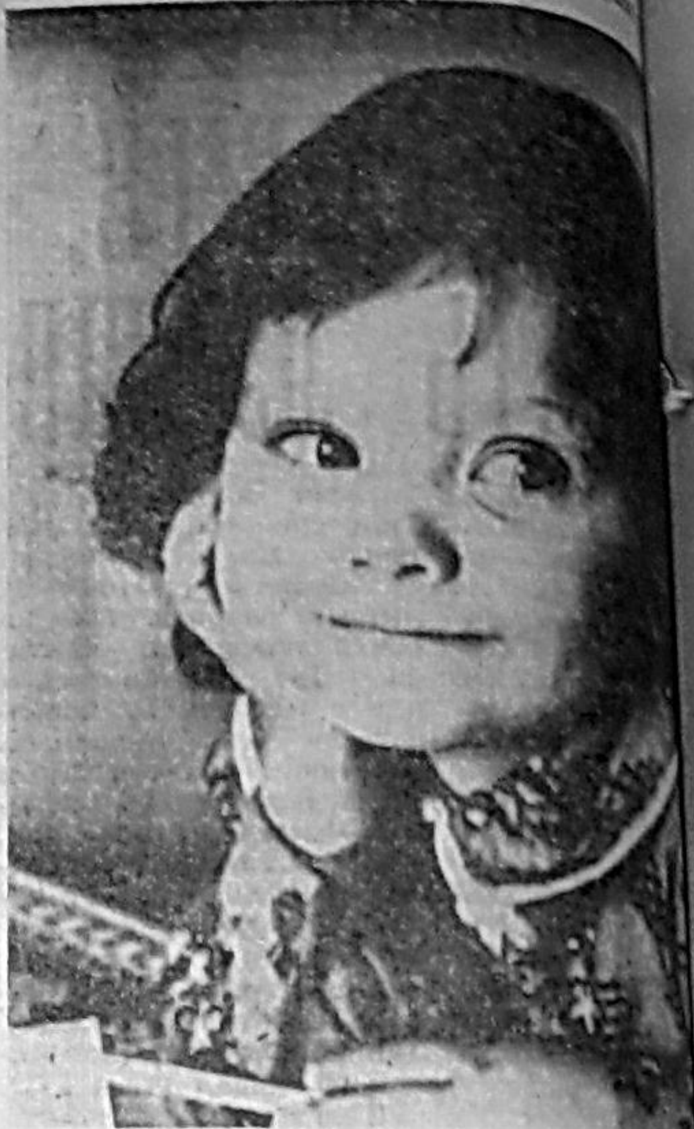
Озорница.