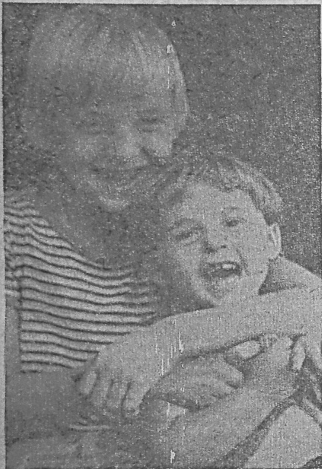
● НА СНИМКАХ: БРАТИШКИ (ВВЕРХУ). В ПОСЕЛКЕ ЧЕРЕМУШКИ (ВНИЗУ).