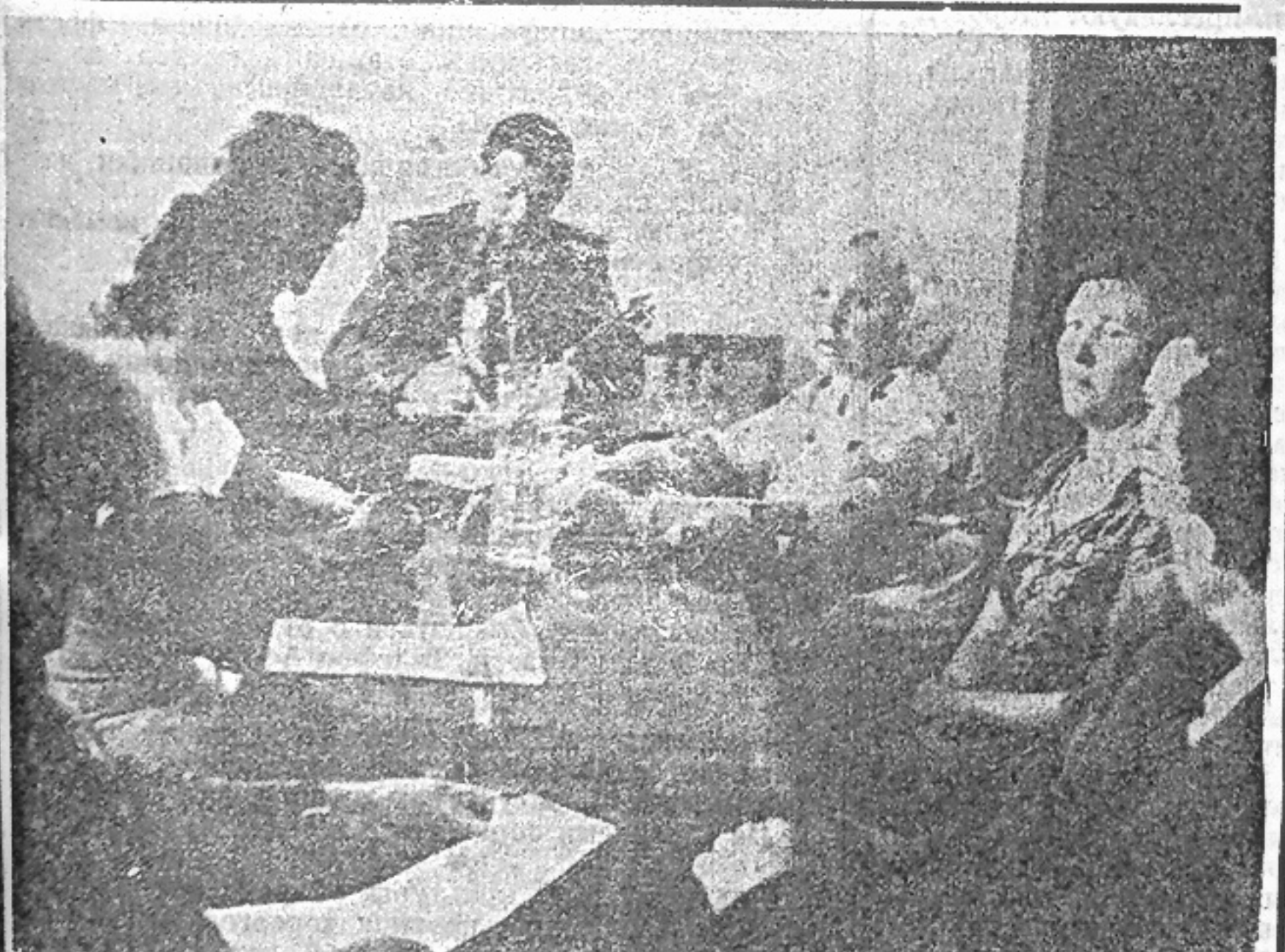
На снимке: за работой постоянная планово-бюджетная комиссия.

Городской Совет обращается ко всем жителям высказать свое мнение по данному вопросу.