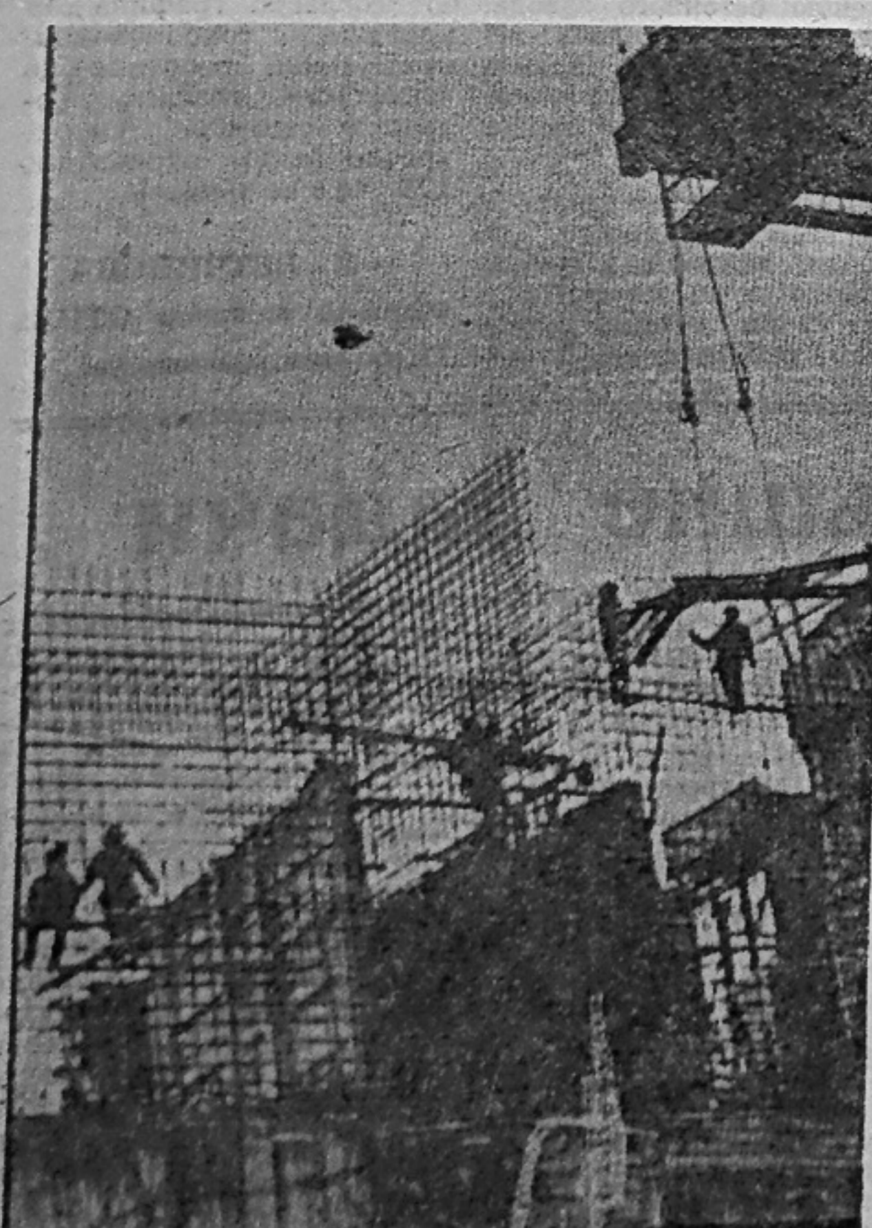
На строительстве Саяно-Шушенской ГЭС.

Следующими на очереди — компрессоры. В. МЫШКИН.