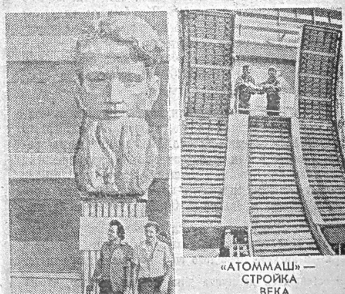
«АТОММАШ» — СТРОЙКА ВЕКА