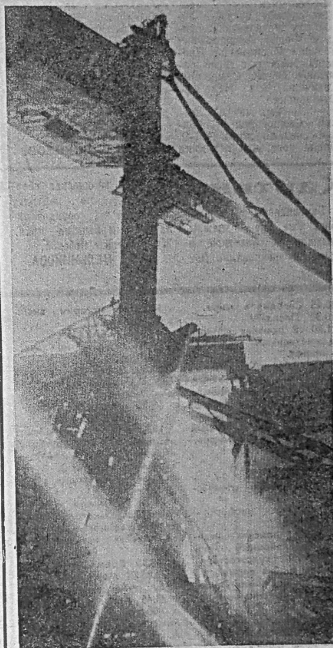
ТРУДОВАЯ СИМФОНИЯ.