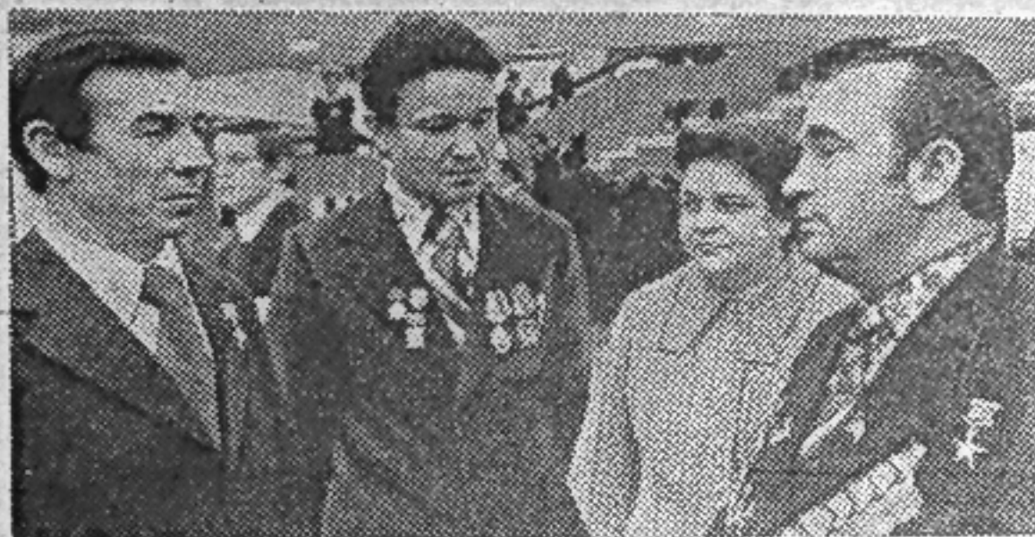
«...Шуя прислала к нам настоящих тружеников, они совхозы в тургайской степи дали название «Шуйский», и стал он одним из лучших на целине».