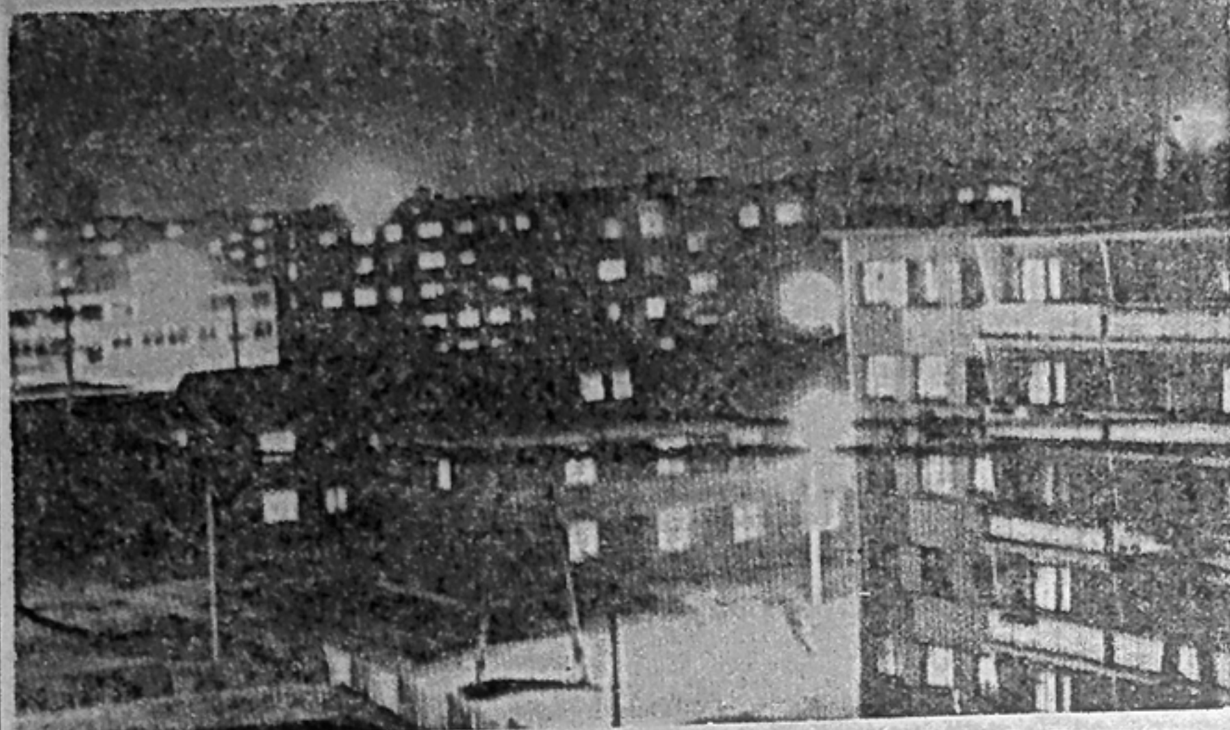
Вечерние огни нашего города.