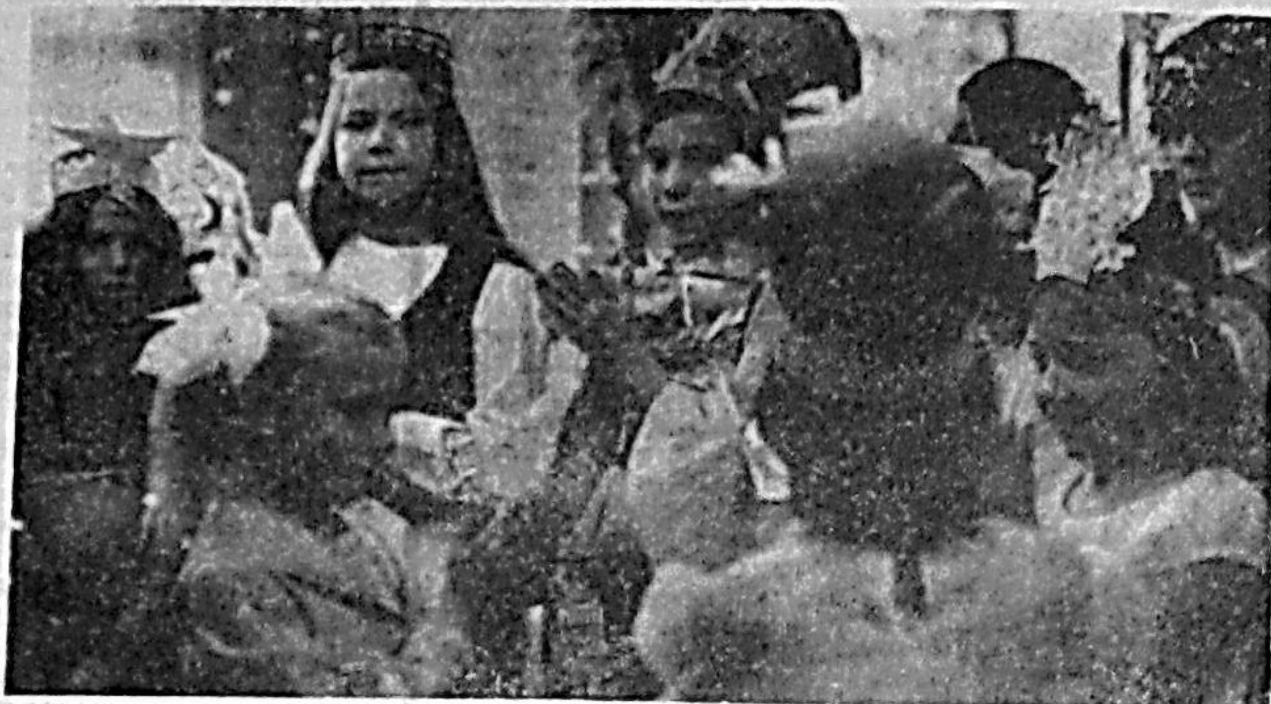
Городской Дом пионеров. У елки.