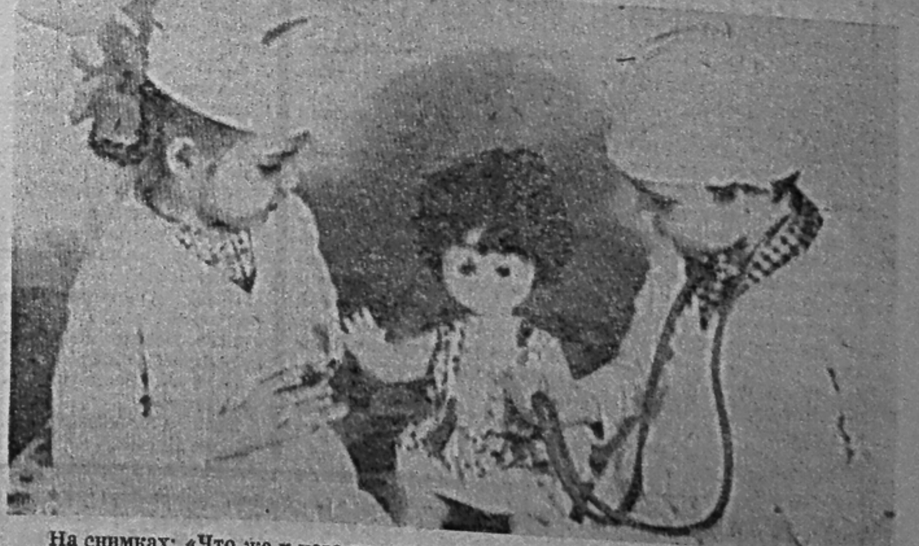
На снимках: «Что же у него получится?»; будущие медики.