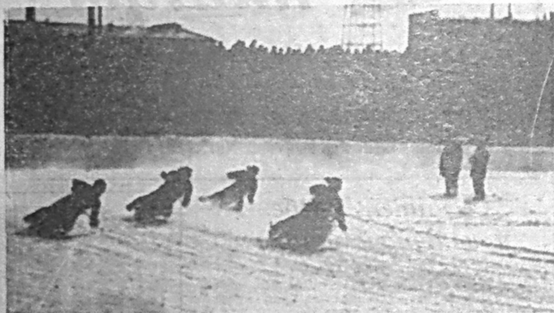
МОТОГОНКИ НА ЛЬДУ.

В 13 часов состоится собрание партийной группы.