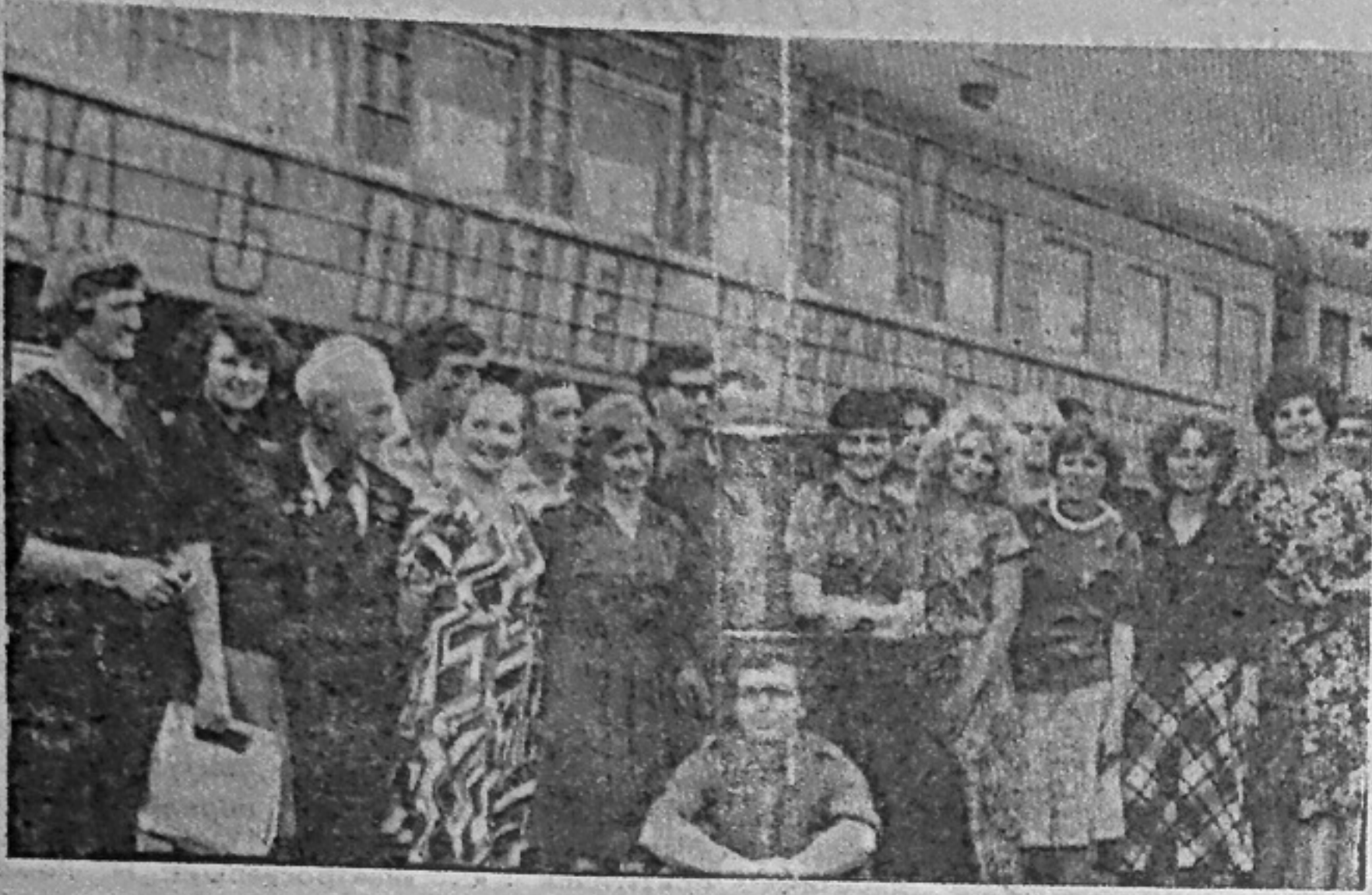
На снимке: памятная встреча в Саянах. Текст и фото Г. ТАРХАНОВА.

С большим интересом жители города Саяногорска и поселков Майна и Черемушки ознакомились с ярким искусством народного ансамбля песни и танца «Стругураш», ансамбля «Орион», агиттеатра «Данко».