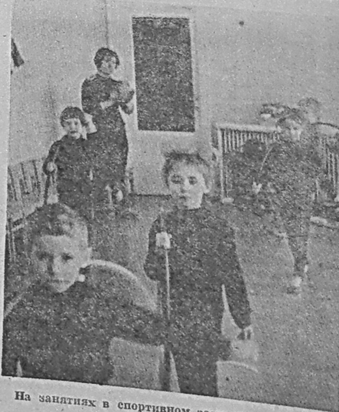
На занятиях в спортивном зале школы.