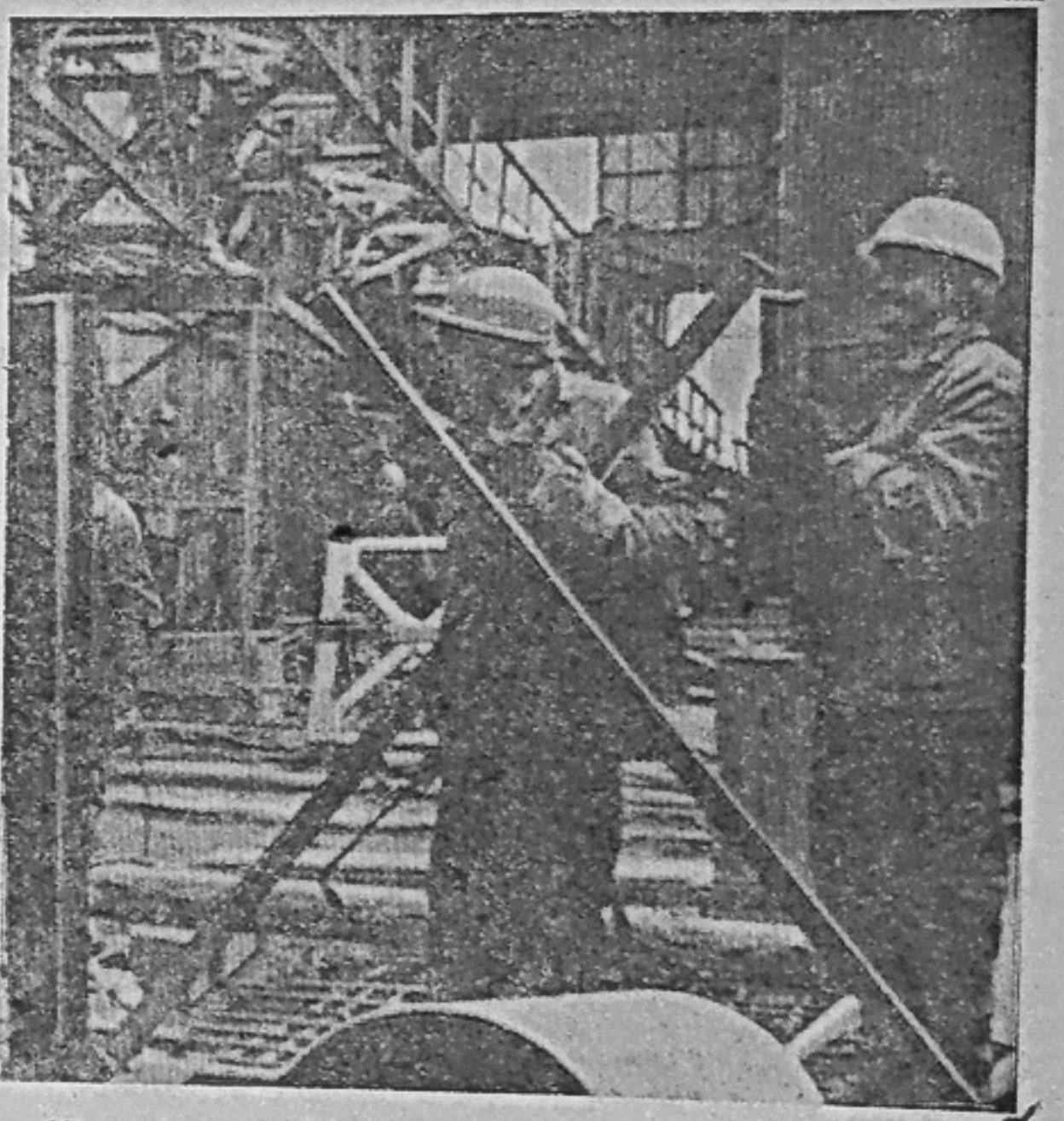
На ударных объектах строительства Саяно-Шушенской гидростанции.