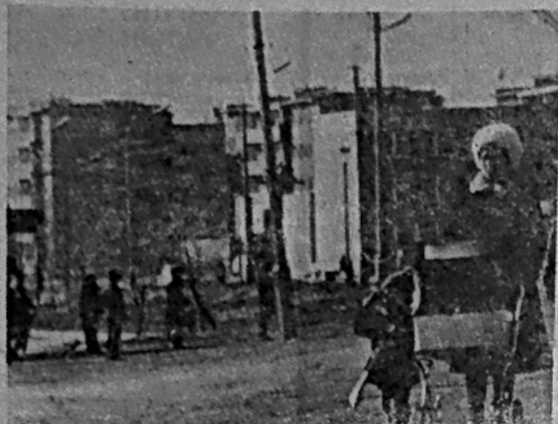
Веселая прогулка.

Завершится творческий отчет подведением итогов работы за год. На заключительный вечер соберутся делегации ребят от каждого класса,