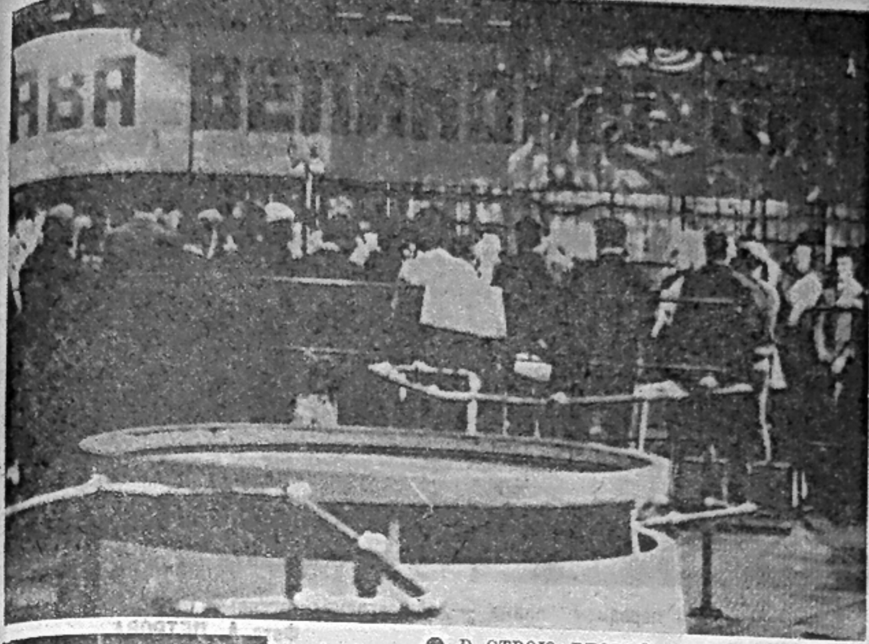
● В СТРОЮ ВТОРОЙ АГРЕГАТ