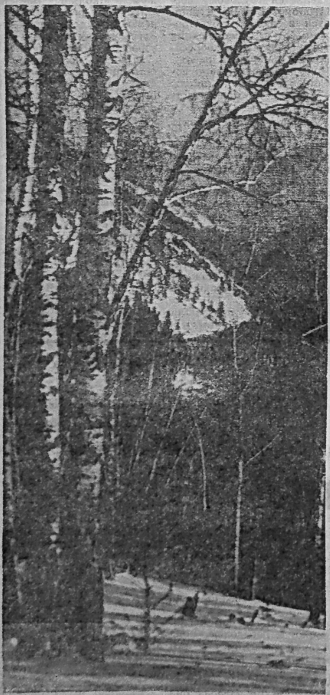
САЯНСКИЕ БЕРЕЗЫ.

Проводится набор на курсы машинистов автомобильных кранов. (2—1)