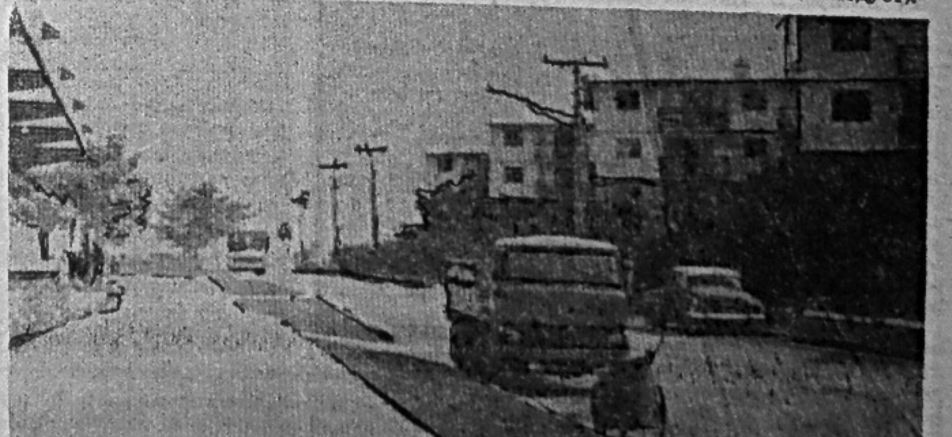
Сельскохозяйственный кооператив Хибакоа. Здесь побывали наши туристы.

Здравствуй, Куба! (Продолжение следует).