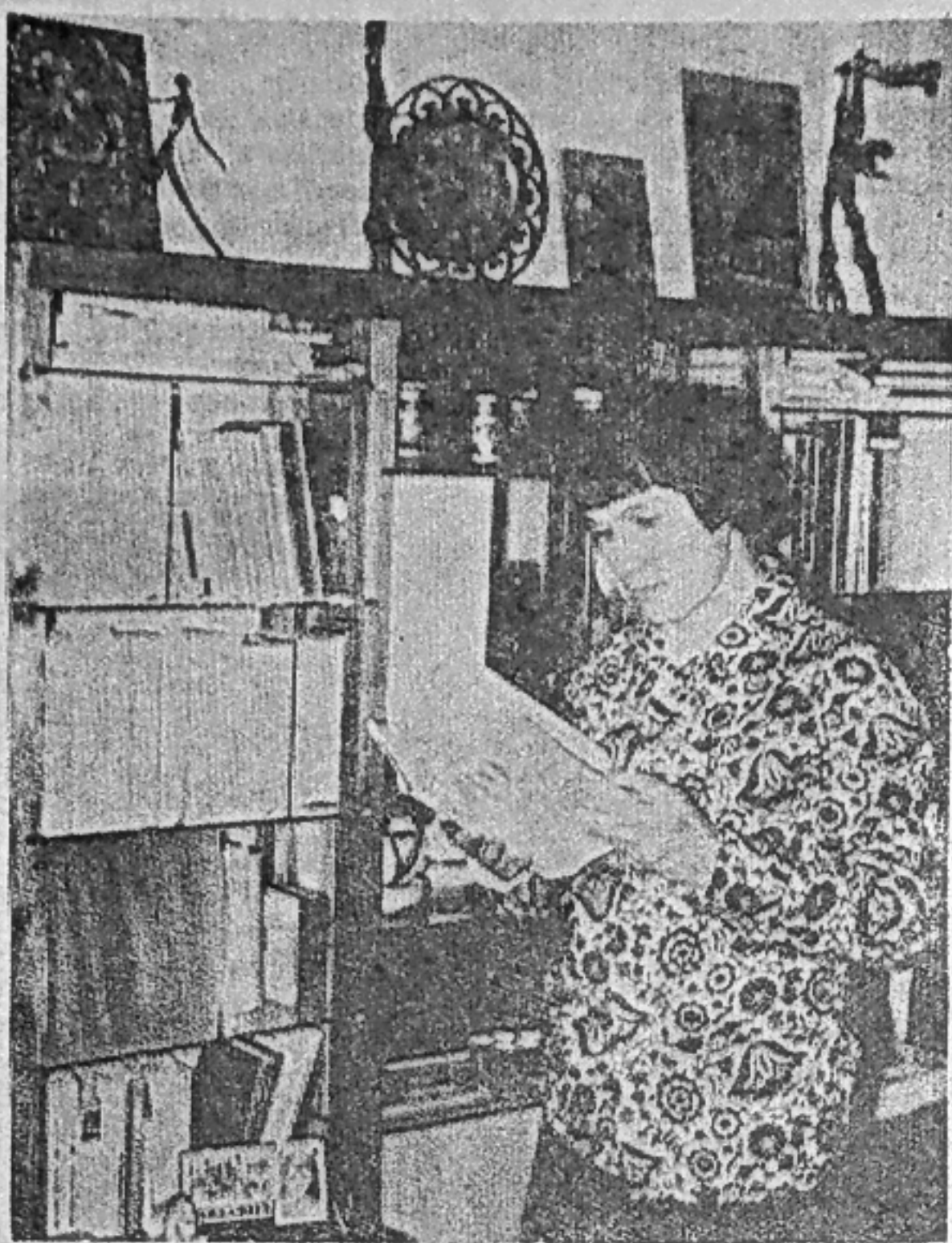
На снимке: молодой ра- Коробов у книжной полки.

Прекрасное в этой комнате было всюду. Парни несут его в себе, и оно отражается в каждой «мелочи» быта.