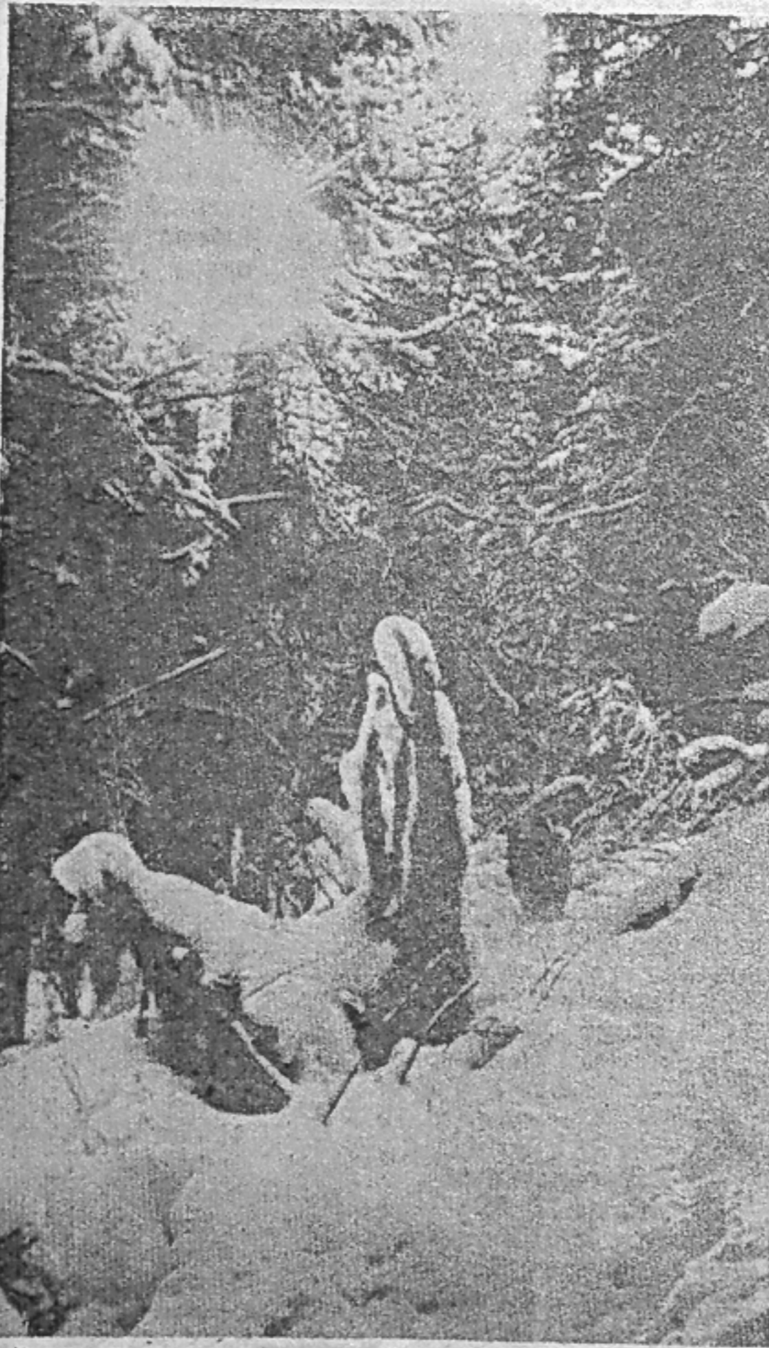
Зимний полдень.

Главное, что нам необходимо для нормальной работы, — это строительство базы. Сейчас уже ведется привязка базы на двести автобусов. Здесь у нас будут хорошие мастерские.